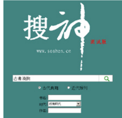
図2 「搜神」トップページ

出典や人名・固有名詞の調査等に役立ちます。キーワード検索すると、キーワードを含む文章の前後約20文字とその出典が表示されます。簡体字・繁体字のいずれでも検索できますが、日本の漢字では検索できません。ここでは、漢籍を検索したいので、「古代典籍」にチェックを入れ、「古書澆胸」と入力して検索すると、次の1件がヒットします。