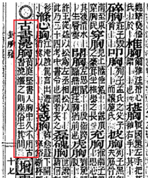
図3 『佩文韻府 2,3巻』の19コマ目より http://dl.ndl.go.jp/info:ndljp/pid/903552/19

この部分の記述から、「古書澆胸」は、黄庭堅という人物の「人胸中久不用古書澆灌之則塵俗生其間」という文章に由来する言葉ということが分かります。