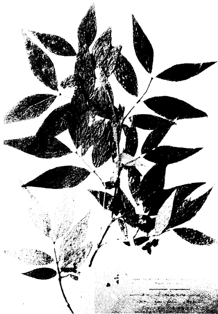
30. ホソバアラゲヒヨウタンボク Lonicera strophiphora FRANCHET form. lancifolia HAYASHI