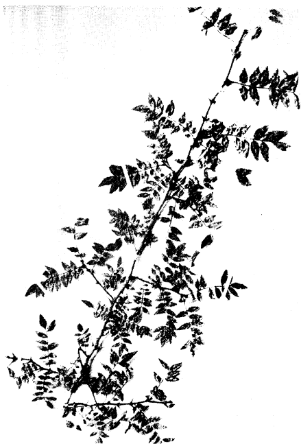
28. アラゲザンシヨウ Zanthoxylum piperitum (LINN.) DC. form. hispidum HAYASHI