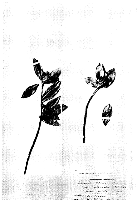
27. ノコバナツルシキミ Skimmia japonica THUNB. var. intermedia KOMATSU form. serrata HAYASHI