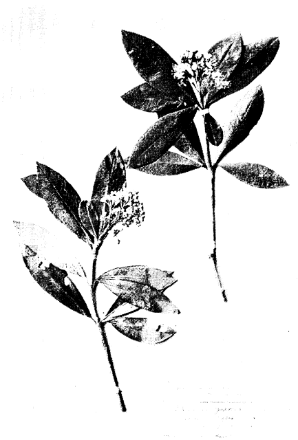
26. アケボノミヤマシキミ Skimmia japonica THUNB. form. rosea HAYASHI