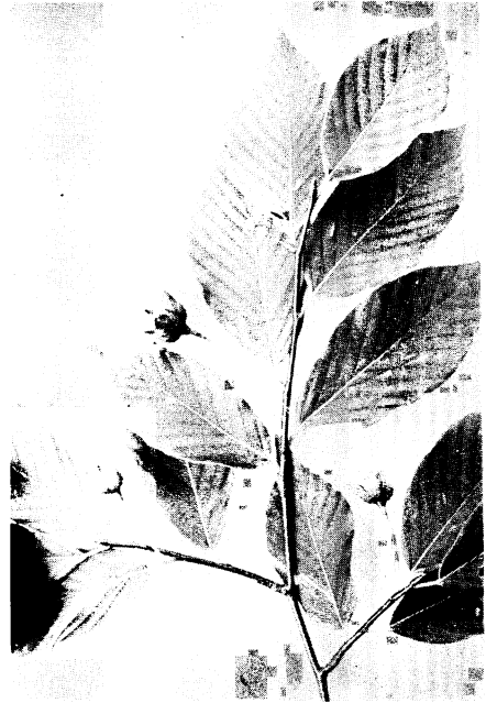
22. ハコイヌブナ Fagus japonica MAXIM. var. pleiosperma HAYASHI