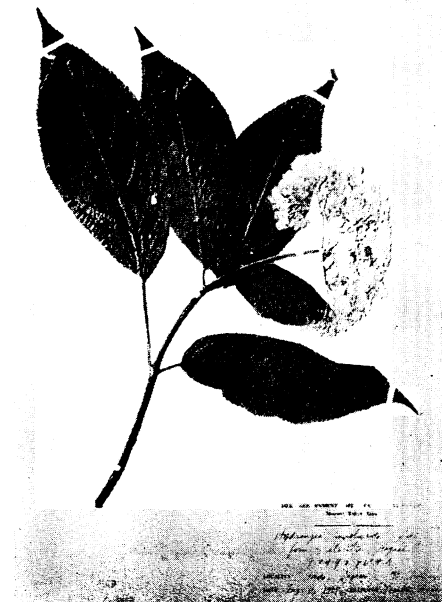
24. テマリタマアジサイ Hydrangea involucrata SIEB. form. sterilis HAYASHI