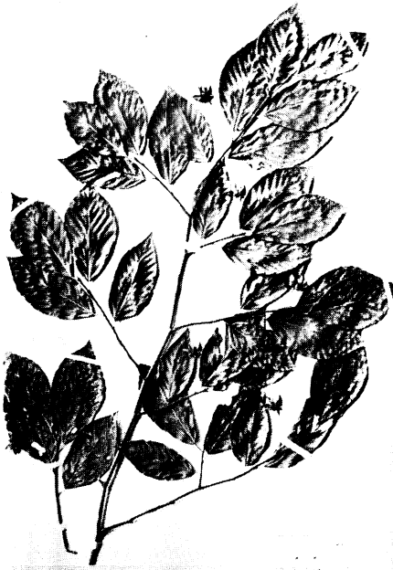
22. ハコイヌブナ Fagus japonica MAXIM. var. pleiosperma HAYASHI