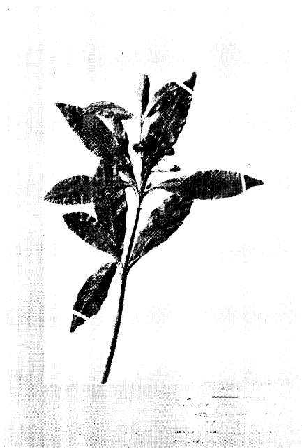
25. ナガミノツルシキミ Skimmia japonica THUNB. var. obovoidea HAYASHI