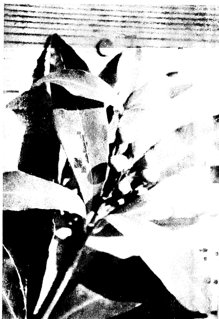
25. ナガミノツルシキミ Skimmia japonica THUNB. var. obovoidea HAYASHI