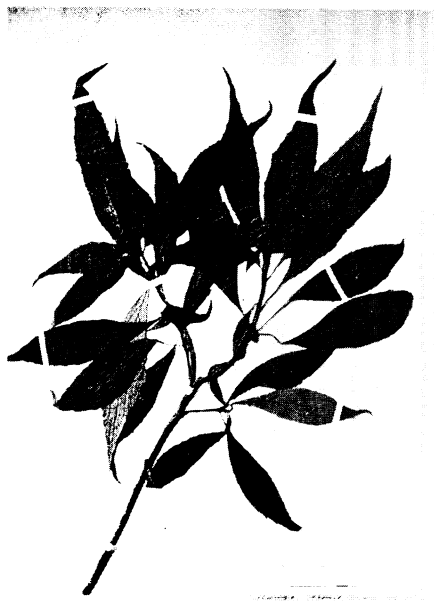
29. ホソバナノハナイカダ Helwingia japonica (THUNB.) F. G. DIETR. form. lancifolia HAYASHI