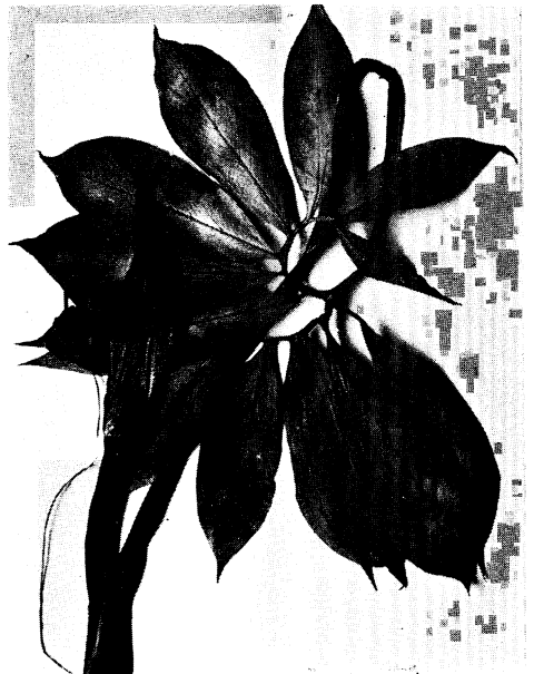
16. カシマウラシマソウ Arisaema Urashima HARA var. kashimense HAYASHI