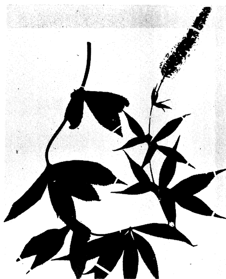
19. シロバナクガイソウ Veronicastrum sibiricum PENNELL var. japonicum HARA form. albiflorum HAYASHI