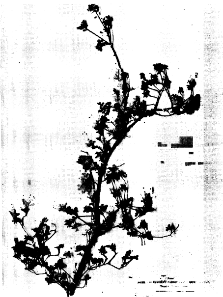
51. アマギウンゼンツツジ Rhododendron serpyllifolium MIQ. form. amagianum HAYASHI