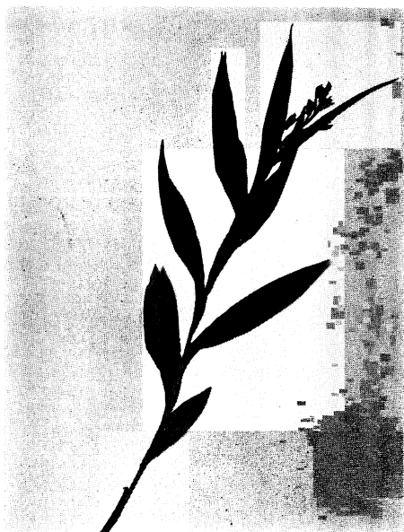
18. ニシダケササバギンラン Cephalanthera longibracteata BLUME form. lurida HAYASHI