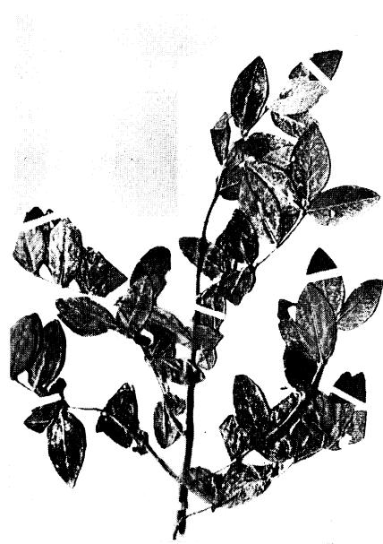
56. ガムシヒョウタンボク Lonicea Morrowii A. GRAY var. gamushiensis HAYASHI