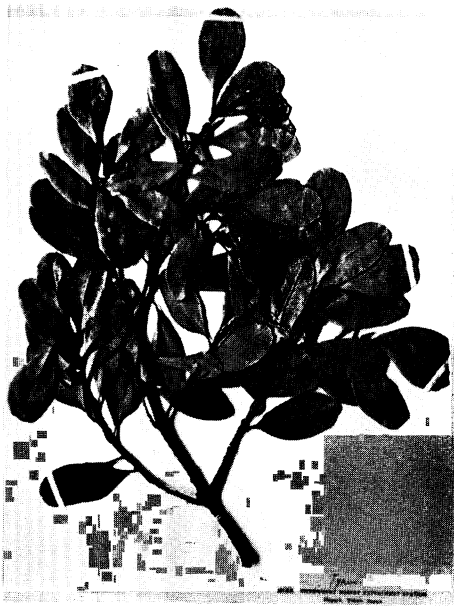
53. ヘラバクロキ Dicalyx lucida HARA form. spathulifolia HAYASHI