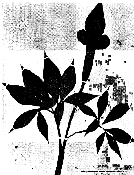
17. キイロミミガタテンナンショウ Arisaema limbatum NAKAI et MAEKAWA form. viridiflavum HAYASHI