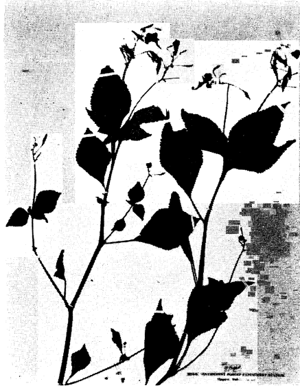
13. ハグロツリフネソウ Impatiens Textori Miq. form. sordida HAYASHI