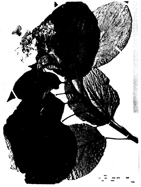
46. ラセイタタマアジサイ Hydrangea involucrata SIEB. var. idzuensis HAYASHI