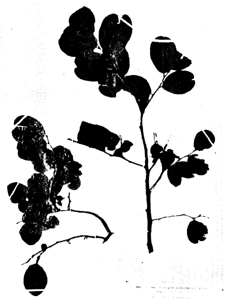
52. マルバナツハゼ Vaccinium Oldhami MIQ. form. rotundum HAYASHI