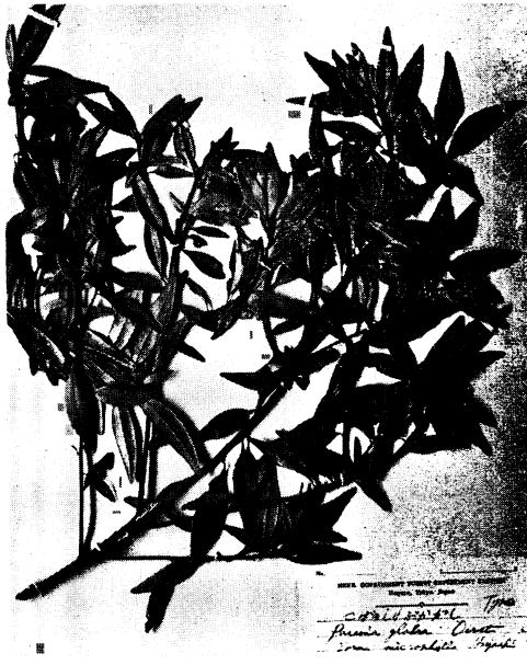
45. コバノシリブカガシ Pasania glabra OERST. form. microphylla HAYASHI