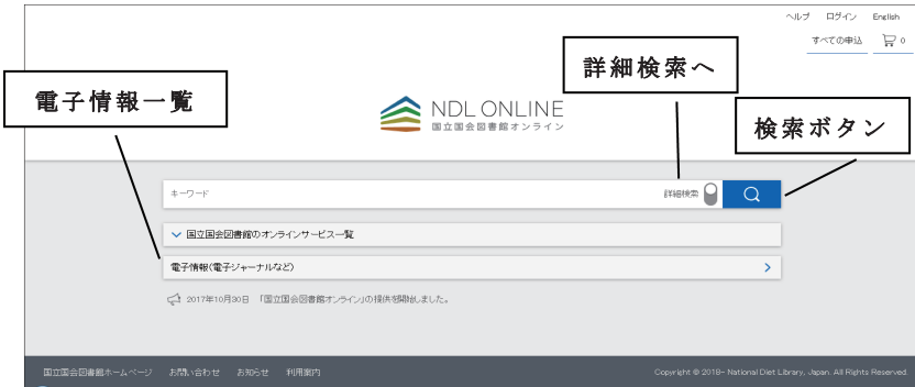
図1 国立国会図書館オンライン (トップ画面) https://ndlonline.ndl.go.jp/