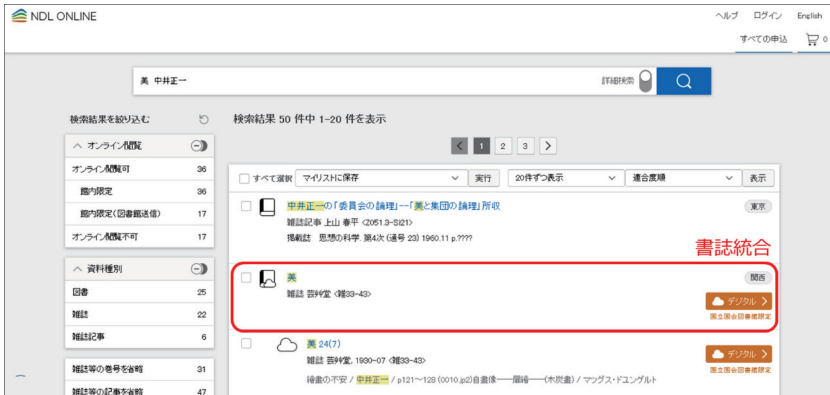
図4 検索結果一覧（書誌統合の表示例）