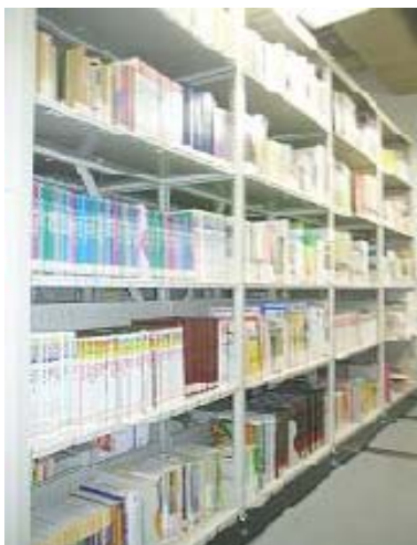
書庫内のアジア資料

知識の本など資料室にない資料は書庫にありますので、カウンターにご請求のうえご利用ください。