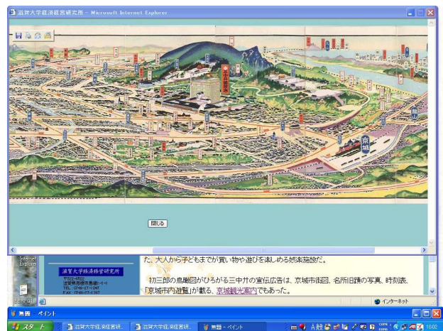
web 上の「三中井呉服店を中心とする大京城案内鳥瞰図」

その当時、百貨店で働いていた人びと、買物に訪れた人びとは今もご存命である方も多くであろう。遠いようで近い過去に触れる楽しい試みであった。また、日本と中国大陆や朝鮮半島と関わり深い資料を所蔵する機関の実務者として、前述したシンポジウムにおける阿部安成助教授の言葉の意味を再確認する時間でもあった。