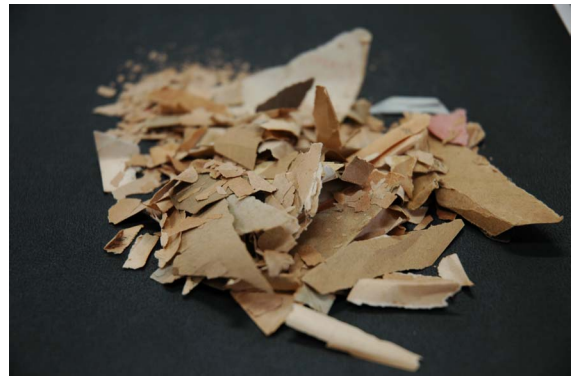
貸出により破損した紙片

周知のように、戦前期の日本語文献資料は、物の不足していた時代に印刷されたこともあり、非常に質の悪い紙に印刷されている。そのため、酸化の進行も早く、現在では手にとって利用すると必ず紙片がはがれるほど、劣化が進んでいる。