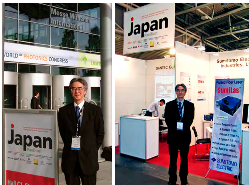
【写真】会場入り口(左)、展示会の日本パビリオンの様子(右)