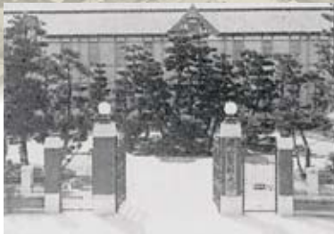
▲大正15年頃の岡山医科大学正門

【表紙写真説明】 岡山大学医学部正門 大正十一年（一九二二年）建設。 かつての岡山医科大学の正門であり、当時の面影を今に伝える。平成二〇年（二〇〇八年）、国の有形文化財（建築）に指定。