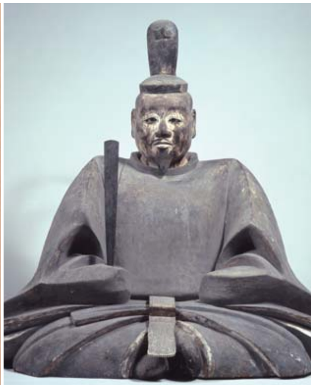
騎馬武者像(国重文・京都国立博物館蔵/左)、足利尊氏坐像(国重文・大分県安国寺蔵/右)