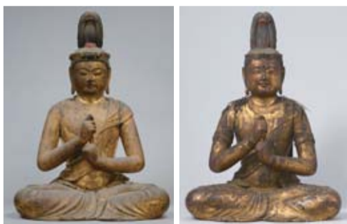
大日如来坐像・国重文 (左)真如苑蔵、(右)光得寺蔵

特別企画展では、このほか尊氏直筆の和歌や、合戦の様子を描いた「太平記絵巻」などの大変貴重な資料も数多く展示します。栃木ゆかりの武将・足利尊氏の足跡をたどってみませんか。