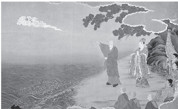
【大師絵伝】より 三鈷杵を投げられるお大師さま