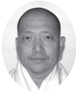
高野山真言宗 総本山金剛峯寺 高野山開創1200年記念大法会事務局長