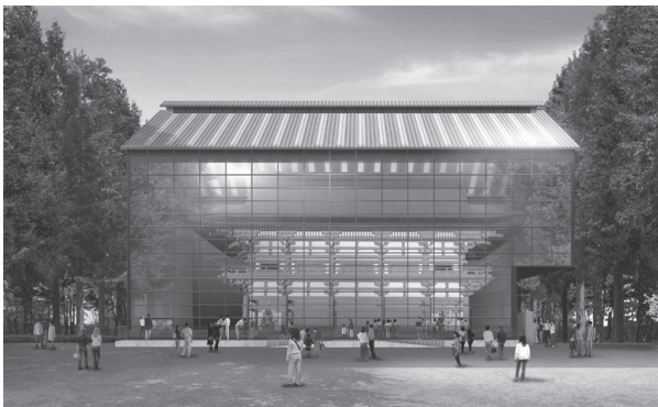
再建中門素屋根(北から)