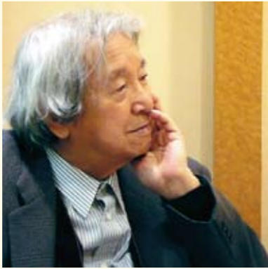
提供:津和野町立安野光雅美術館

1934年、山形県東置賜郡小松町(現・川西町)生まれ。1983年にこまつ座を創設し、多くの戯曲を書き下ろし上演。小説に『手鎖心中』『青葉繁れる』『吉里吉里人』『東京セブンローズ』、戯曲に『父と暮せば』『太鼓たいて笛ふいて』などがある。1998年から2007年まで仙台文学館の初代館長をつとめる。2010年4月9日没。