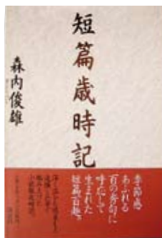
森内俊雄 『短篇歳時記』 (講談社)

小学四年生のころから本に親しみ、さまざまな小説を読んだけれど、いちばん最初に強い影響をうけたのは、高校時代に出会った福永武彦の『忘却の河』だろう。はじめて小説を読んで泣いた本であり、これで日