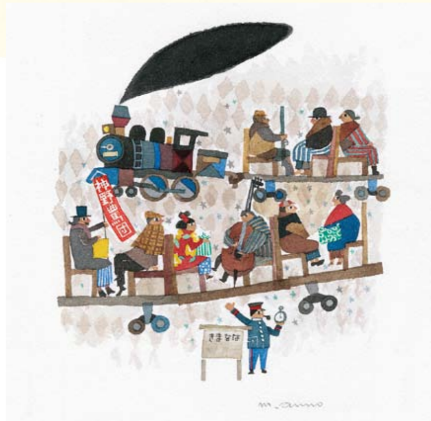
『イーハトーボの劇列車』

本展では装幀画家、デザイナーとしての仕事に焦点を当て、二人が手掛けた仕事を振り返るとともに、最新の描き下ろし作品、井上ひさし文『ガリバーの冒険』の絵本原画や芝居『藪原検校』のポスター原画をはじめ、代表的な作品をご紹介します。