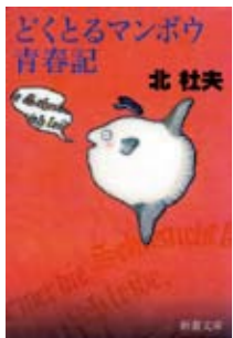
『どくとるマンボウ青春記』 (新潮文庫 2000年)