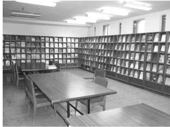
写真 5 国立科学図書館

社会運動家ラージャ・ラームモーハン・ローイ (1772-1833) の生誕 200 年に当たる 1972 年、