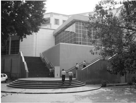
写真3 インド国立図書館 新館