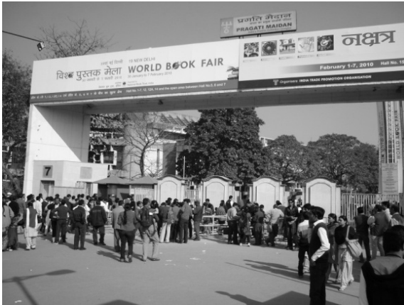
写真1 ニューデリー国際ブックフェア 会場入口

国、ドイツ、日本等からの参加者を含む、国内外 1,200 の出版社、取次業者等がブースを構えた。42,000 m 2 の広さをもつ会場では、英語出版物、インド諸言語の出版物、児童書といった区分ごとに建物が割り当てられ、いずれも目当ての出版物を探し求めるインド人の熱気で溢れていた（写真2）。その中でも、諸言語出版物を扱う建物では、ウルドゥー語の宗教書、サンスクリット語の古典文学をはじめ、ブース毎に特色ある書籍が並んでいた。また、児童書を求める家族連れも多く、会場では、読み聞かせ、物語創作等のイベントが行われていた。