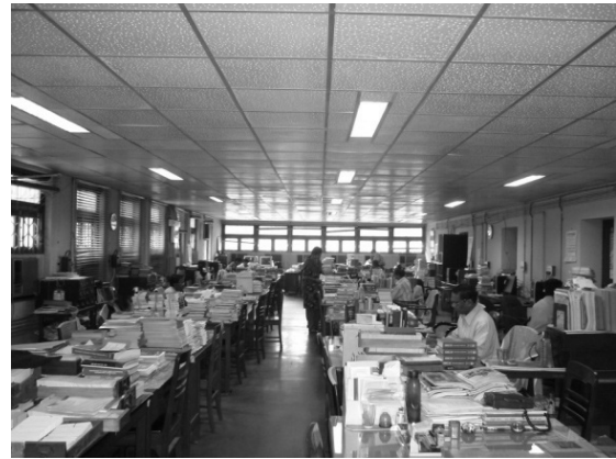
写真4 インド全国書誌の作成風景

目下、図書館機能の電子化が進められており、目録のデジタル化に関しては、所蔵図書のレコード 14万件が MARC21 フォーマット 23 に置き換えられ、OPAC 上での公開が始まった 24 。また、貴重書のデジタル化についても、図書 9,000冊余り、320万ページ分の作業が完了している。