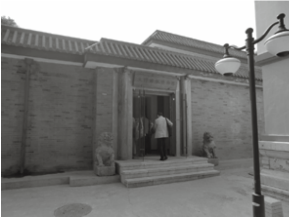
文津木版印刷博物館