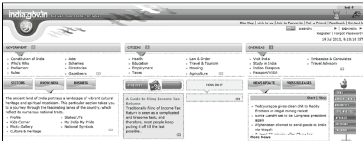
図表1 NPIのトップページ (http://india.gov.in/)