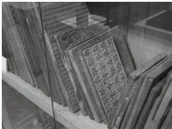
文津木版印刷博物館 木版印刷の版木

のグレーの壁と調度品に使われている新しい木材の茶色、かつて使われていたために墨を十分吸った版木の黒の3色が調和するモダンな雰囲気建物の建物であった。