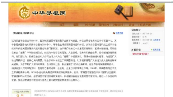
図 6 「中华寻根网」尋根百科

第一は、族譜に関する事項を収録するオンライン事典「寻根百科」である (図 6)。ウィキペディアのように、登録ユーザーが編集に参加できる。