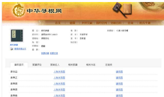
図 4 「中华寻根网」詳細画面

族譜に記載のある男性成員の人物関係図のほか、居住地に関する地方志、歴代居住地の変遷表などを閲覧できる (画面は清・廖月巖修『廖氏族譜』(同治 5 年刊))