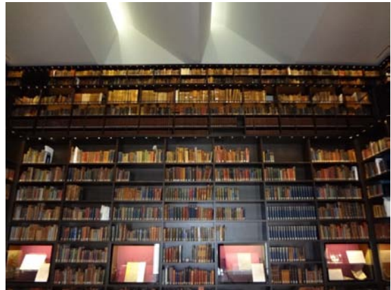
東洋文庫ミュージアム「モリソン書庫」

その後モリソン文庫の資料は「モリソン書庫」に移され、2011年10月のグランドオープンにより公開展示された。この「モリソン書庫」は展示、保存、利用提供を同時に行う画期的な試みである。構築されたデータベースと、その活用の成果ともいえる「モリソン書庫」が今後の研究を発展させるための基礎となれば幸いである。