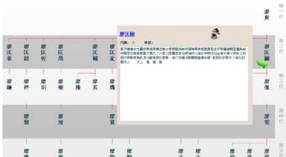
図 5 「中华寻根网」譜系図 (人物関係図)

族譜に記載のある男性成員の人物関係図のほか、居住地に関する地方志、歴代居住地の変遷表などを閲覧できる (画面は清・廖月巖修『廖氏族譜』(同治 5 年刊))