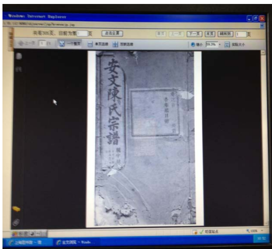
図2 上海圖書館族譜全文データベース画像

2006年9月に族譜閲覧室内の端末で第1期データ約3,000タイトルが公開された。現在は10年計画の最終段階にあり、すでに1万タイトル以上の族譜の全文画像が館内で閲覧できる（図2）。画像はJPEG方式、カラースケールを採用し、解像度は300dpiである。先行して公開された目録データベース「家譜数据库」とのデータ統合も行なわれ、タイトル、著者、出身著名人、居住地などの7項目からの検索が可能である。ただし全文テキスト検索はできない。なお、この全文画像は館内公開のみであり、インターネット上では書誌検索のみ可能であるが、同館が作成する雑誌新聞記事索引データベースである「全国报刊索引」と同じように、パッケージとして他機関への販売を計画しているようである 9 。