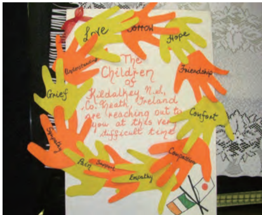
アイルランドより