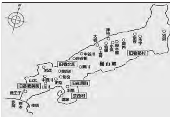
地図3 大忍荘の荘域図

の、高知市から見て東北部の、徳島県との境に位置しています。北側は観光でも知られる祖谷山地域で、かづら橋があったり平家の落人伝承があったりするところです。最近では子泣きじじいという妖怪の伝承地であったというので、妖怪で町おこしをしようとしている、そんな地域です。その南側が物部です。私が調査していたころは両地域は婚姻関係も結構あったところですね。