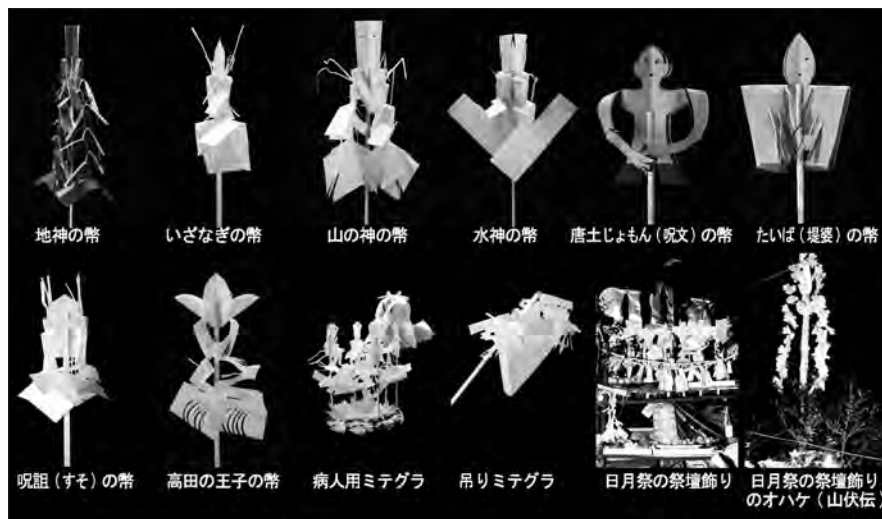
写真16 さまざまな種類の御幣