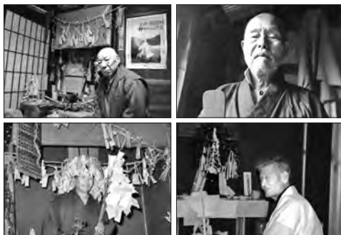
写真6 いざなぎ流の太夫たち

うが早いのではないかと考えましたが、弟子入りするとそのメリットと同時にデメリットもありますので、弟子入りは止めました。弟子入りして一人の太夫さんの知識を深く知ろうとすると、ほかの太夫のところに行っちゃいけないといった規制を受ける。ですから、その太夫さんの知識を深く知ること