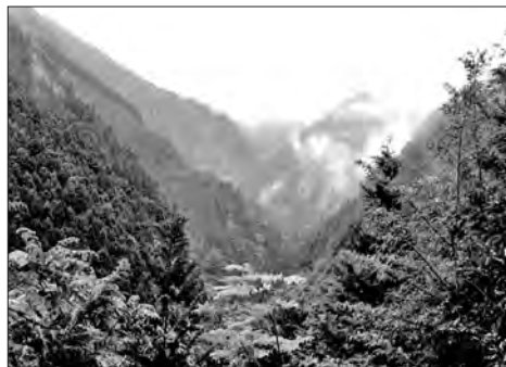
写真1 物部の険しい深く険しい山と谷

写真1をご覧ください。このように、非常に山深いところにあるのが物部という地域です。旧村のほとんどが森林に囲まれていて、よく人が住めるものだと思うところにへばりつくように集落がポツポツと点在しています。四国の山というのは険し