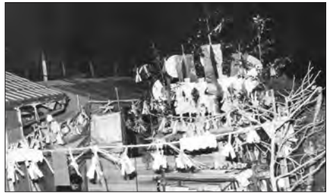
写真12 日月祭の祭壇と舞台