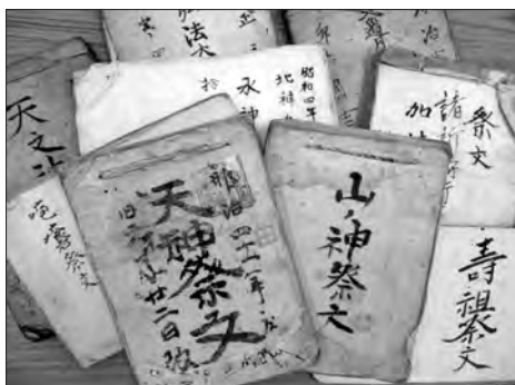
写真14 さまざまな種類の祭文

もう一ついざなぎ流の大きな特徴として、御幣があります。儀礼に用いられる御幣なのですが、これがたくさんの種類があるのです（写真16）。