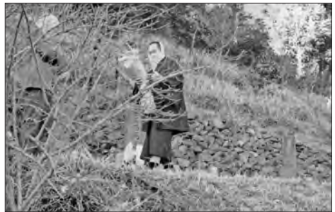
写真13 ミコ神の取り上げ