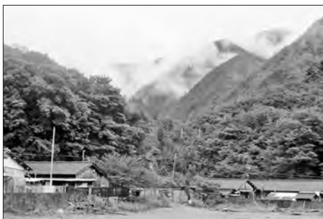
写真3 バス別府終点付近の営林署宿舎（1971年）

この会場の入口にゆずが置いてありましたね。物部では、現在はゆずの栽培が盛んになっており、仙頭でもゆずが盛んに栽培されています。ですが、それ以前は棚田が広がっていました。棚田になる前、中世では違う作物も栽培されていたのではないかと思います。だいたい昭和40年代以前の写真を見ますと、きれいな棚田、段々畑がつくられておりました。写真の中央上方、集落を眺め渡すことができる高い所に、土居と呼ばれる名主（庄屋）屋敷があります。また、写真の右手側の小山の