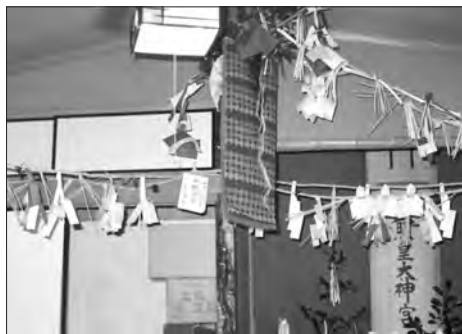
写真10 バッカイ(白蓋)