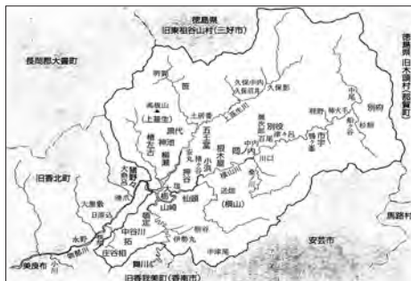
地図2 旧物部村略図