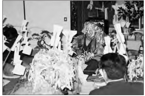
写真7 本神楽（御崎の神楽）

たものです。これが一番芸能的な性格がある部分なので、それを取り出して見ていただこうとしたものなのです。いざなぎ流の神楽とは舞神楽のことだと思われていた方がおられるかもしれませんが、そうではなく、神楽の本体部分は別にあり、その神楽の一番最後の最後のところでなされる舞を舞神楽と呼んでいるのです。