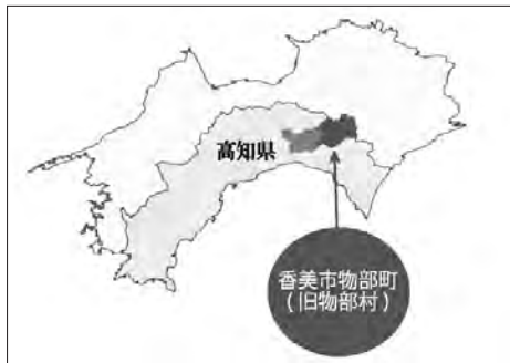
地図1 香美市物部町 (四国全図)