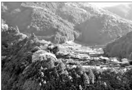
写真4 仙頭本村遠望 中央上方が土居