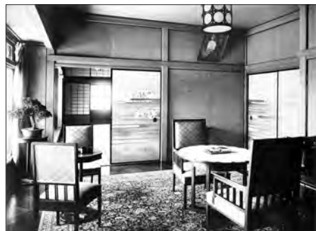
芝区伊皿子の堀越邸。敷地約2250坪、建坪約520坪、1924年築。

工場払い下げとデフレ政策を軸に金本位制への道を拓いた反面、政商の財閥への発展と農村の窮乏による自作農の小作農への転落を促したことで知られている。