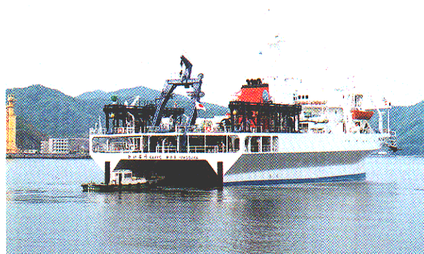
平成11年5月ドック後