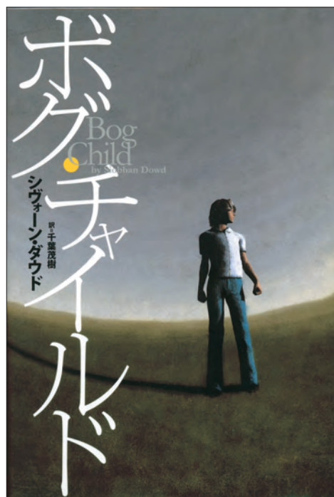
『ボグ・チャイルド』 シヴォーン・ダウド 作 千葉茂樹 訳 ゴブリン書房 2011 <請求記号 Y9-N11-J185> p. 41参照