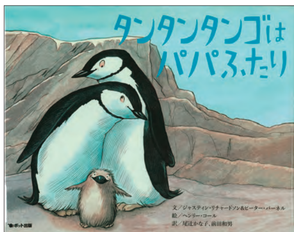
『タンタンタンゴはパパふたり』 ジャスティン・リチャードソン、ピーター・ パーネル 文 ヘンリー・コール 絵 尾辻かな子、前田和男 訳 ポット出版 2008 <請求記号 Y18-N08-J199> p. 64参照