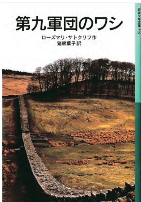
『第九軍団のワシ』 ローズマリ・サトクリフ 作 猪熊葉子 訳 岩波書店 2007 <請求記号 Y7-N07-H83> p. 17参照