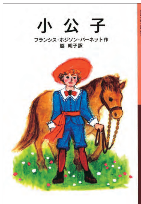
『小公子』 フランシス・ホジソン・バーネット 作 脇明子 訳 岩波書店 2011 <当館請求記号 Y7-N12-J28> p. 75参照