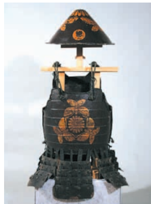
菊三蝶紋足軽胴と陣笠(伊澤コレクション)

主な展示資料：「雑兵物語」(東京国立博物館・國學院大学図書館蔵)『雑兵物語』(当館蔵)