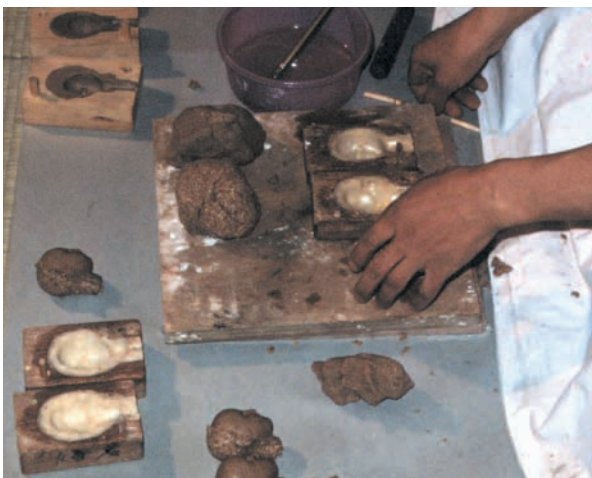
桐粉と正麩糊を練り込んだ桐塑を型に詰める