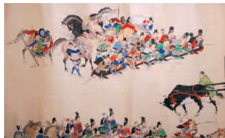
「平治物語絵巻」(摸本)(当館蔵)

主な展示資料：『将門記』・「平治物語絵巻」(摸本)・「蒙古襲来絵詞」(摸本)(いずれも当館蔵)