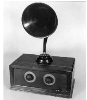
ラジオ（四球式交流受信機）

自由主義思想に基づく大衆文化、労働争議や米騒動、関東大震災などによる苦しい県民生活の様子などを紹介しています。