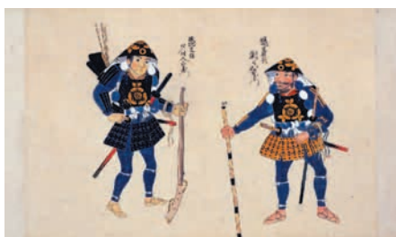
「雑兵物語」(東京国立博物館蔵)

この「雑兵物語」は、江戸時代の泰平の世になって、忘れつつある合戦の心得を知るための武士たちの教科書ともいえ、彼らの危機意識から写本が多く作成されました。やがて幕末の外国船渡来による攘夷運動の中で再び脚光を浴びて出版されましたが、西洋式の戦争ではもはや時代遅れの内容となっていました。