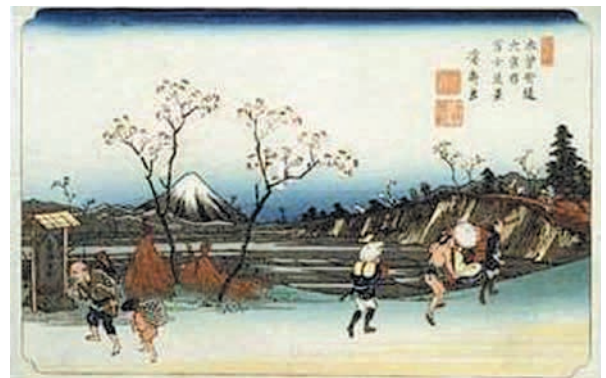
木曾街道大宮宿富士遠景 (英泉画)

その中の1つ、大宮宿の成立は、文禄年間から慶長7年前後と考えられています。現在の道筋とは異なり、大宮公園内に建つ氷川神社の参道の一部が中山道の道筋だったようです。寛永5年(1628)に今現在の道筋に付け替えられとされています。