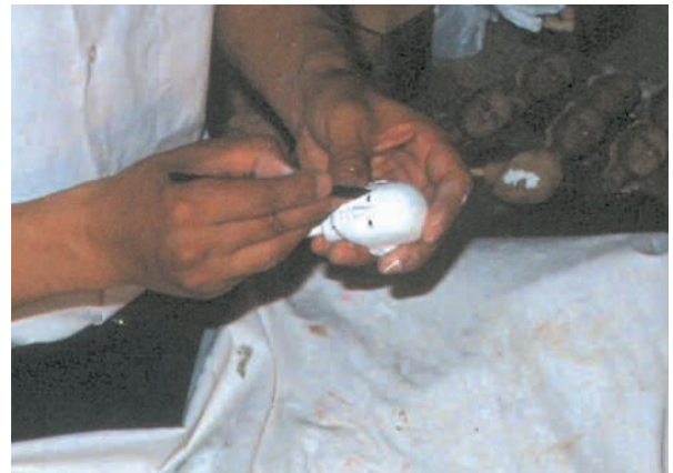
切出しで目、鼻や口を削って整える

ちなみに埼玉県は、全国一の生産高を誇る雛人形の産地です。さいたま市岩槻区、越谷市、鴻巣