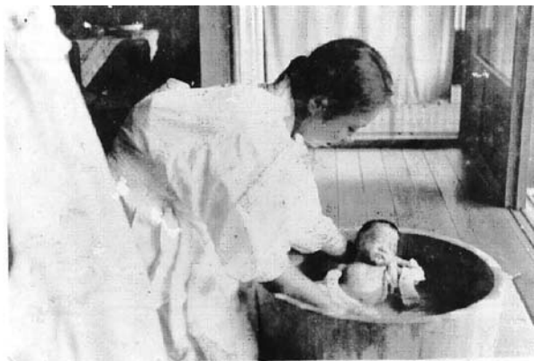
たらいで産湯をつかう（小川町 個人提供）

展示は次の4つのテーマに分けてみました。①小さな命とその成長、②幾久しき祝いの儀、③年を重ねて、④死と魂のゆくえです。①では安産祈願の信仰に始まる出産の儀礼を中心にして、赤ん坊から子供、やがて若者へと成長をしてゆくまでを取上げています。②は結婚にまつわる習俗。特に花嫁が最初に嫁ぎ先の家に入るときには、杖をついたり、たいまつ たいまつ の火をまたいだり、玄関で姑と杯を交わしたり等々、今では見ることのできない独特の儀礼がありました。③では厄年 やくどし と年祝い としいわ を扱います。年祝いとして県内で広く行われたのは米寿の祝いで、寿命が短かった時代にはその長寿にあやかろうとしたものです。④では伝統的