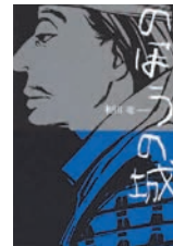
『のぼうの城』表紙 （和田 竜 著 オノ ナツメ装画 ／小学館）