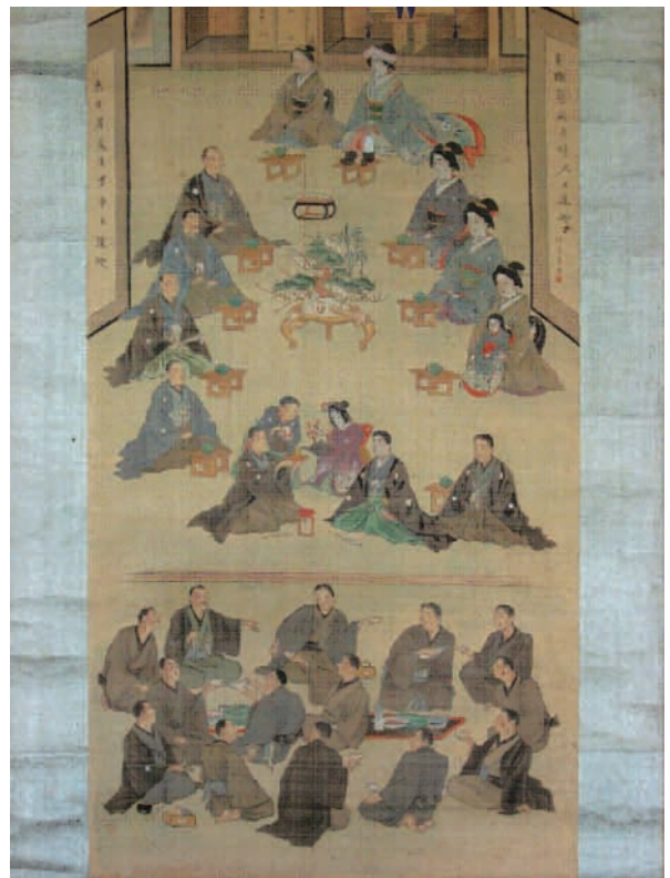
明治35年の婚礼図（小川町 個人蔵）