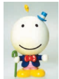
さいたま博覧会のマスコット「サイターマン」

産業経済の高度成長に伴う県勢の発展、その象徴として東京オリンピックや埼玉国体・さいたま博覧会などを紹介しています。