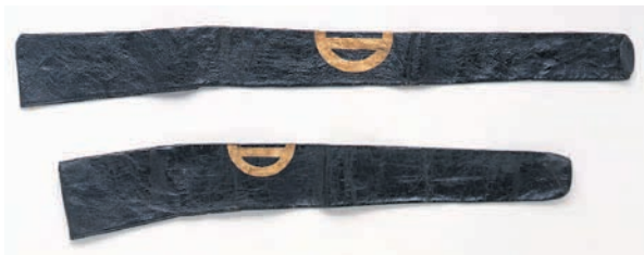
火縄銃付属資料のうち鉄砲筒（国立歴史民俗博物館蔵）

雑兵は、最前線を駆け回って戦うため身軽に動けるように軽武装でした。武士が兜や鎧など重装備であるのに対して、陣笠や足軽胴といった軽易な防具です。しかし、これらは自前ではなく主家からの御貸具足であり、鉄炮や槍等の武器も同様でした。そのため陣笠や足軽胴には、合印という敵味方を判別する家紋や図様が描かれています。