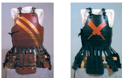
足軽胴(伊澤コレクション)