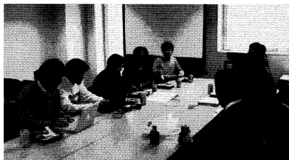
第1図 シンポジウム世話人の会議風景.

る考え方である水を「大気循環を駆動する熱源」として捉える手法から一歩進んで、湿潤過程を含むテレコネクション、海面水温に対応する湿潤大気の応答を理解する必要性を示した。同時に、水の相変化が中緯度の様々な気象現象に及ぼす影響とそのモデルにおける表現についても言及した。そして、多重スケールの相互作用の解明を行っていくために、新しい道具として高解像度、ダウンスケールされたモデルの必要性を示す一方、概念としての大規模場の理解を忘れてはならない事も強調した。