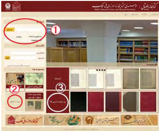
図7 マレク国立図書館デジタルライブラリー