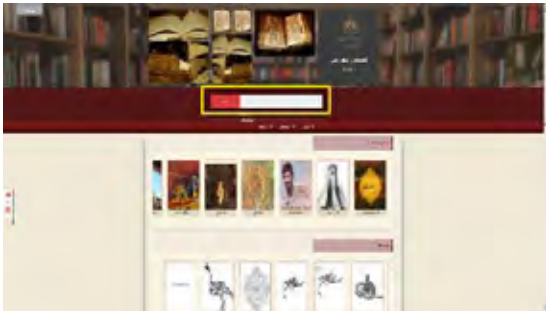
図2 イラン国立図書館デジタルライブラリー