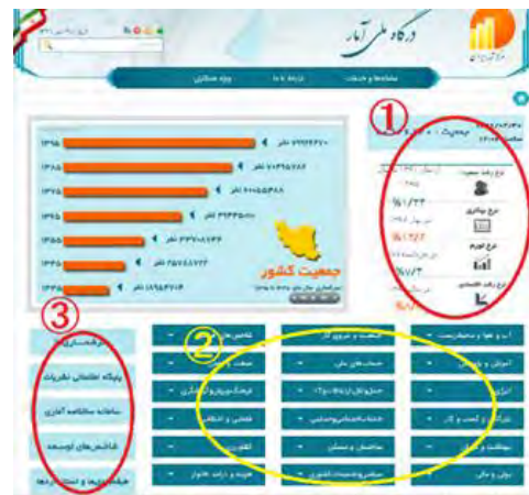
図6 統計情報のページ