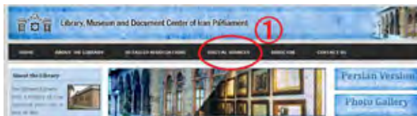
図4 議会図書館ウェブサイト