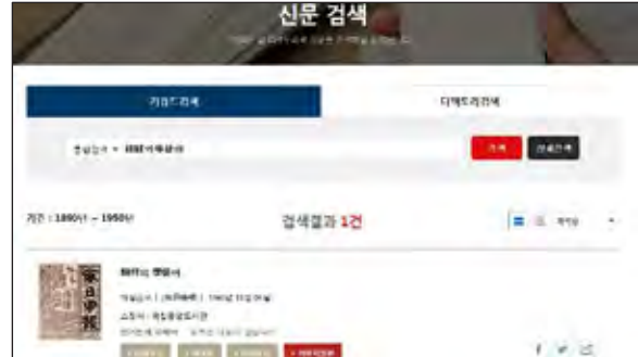
図2 「大韓民国新聞アーカイブ」のキーワード検索による「朝鮮의學徒여」の検索結果

「대한민국 신문 아카이브 (大韓民国新聞アーカイブ)」でも、キーワード検索にて『毎日新報』の原文が閲覧できます。ただし、当館所蔵の縮刷版同様、文字の判読が困難な部分があります。