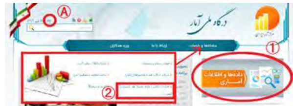
図5 統計センターウェブサイト

ト(図5) 14 で全ての内容を閲覧することができ、メールで電子版を送信するサービスもある。このほか、統計センターの過去の全刊行物もスキャニングし、ウェブサイトで公開している。また、メールによるレファレンスサービスを行っており、ウェブサイトからでは入手できない統計情報については、このサービスを通じて入手できる可能性がある。