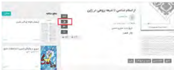
図11 資料の詳細情報