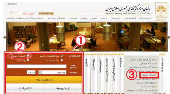
図1 イラン国立図書館・文書館ウェブサイト