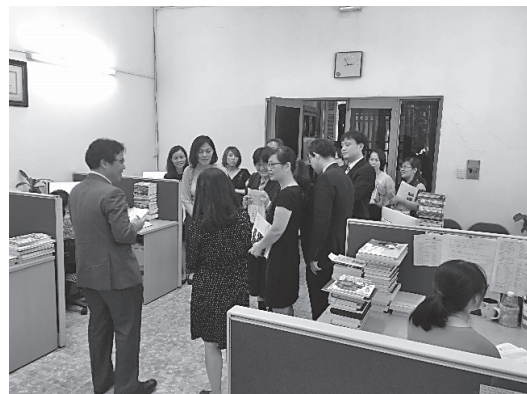
目録編成室の様子

このようにして収集した資料は、1週間で整理、分類、納架され、利用に供される。整理は目録編成室に所属する19人の司書が行い、週500冊から600冊程度整理しているとのことである。なお、雑誌については、納本室という別の部署で作業しているとのことである。