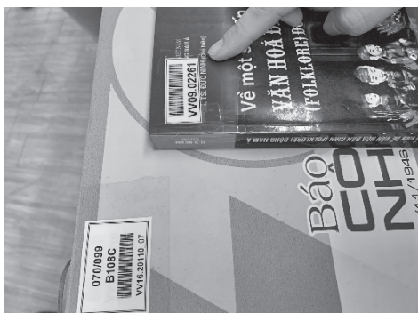
左の標示が開架用、右の標示が書庫用

整理を終えた資料は、まず開架式書架に排架され、4年経過すると書庫に移される。開架式書架と書庫では、ラベルも排架の順序も異なる。開架式書架がDDCで排架されているのに対し、書庫は受入順で排架されている。