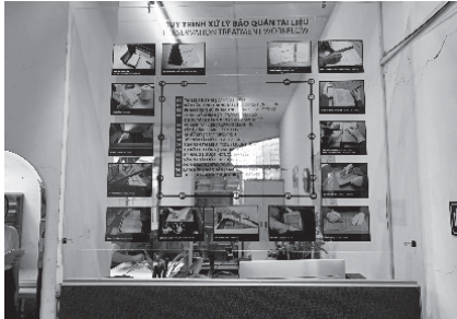
保存室に掲示されている資料保存の手順図

日本の和紙は高価なため、文字でないところはベトナムの紙を使っているとのことである。また、糊はでんぷんではなく、CMC（カルボキシメチルセルロース）を海外から輸入して使っているとのことであった。