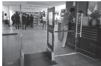
閲覧室の入口の様子

閲覧室の資料はDDCにより排架されるが、背表紙にはDDCではなく書庫用の標示がされていて一見して分類が分かりづらいことから、背表紙に貼付されたシールの色を変える（赤色）ことで、視認性を確保している。