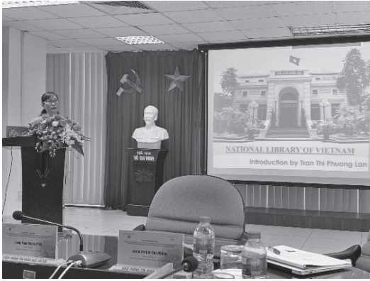
ラン課長の発表の様子

また、国の中央図書館として、様々な図書館業務への技術を導入する活動を行っており、MARC21、デューイ十進分類法第23版(DDC23)のほか、2018年末にはRDAを導入し、全国各地の司書のための研修も行ったとのことである。