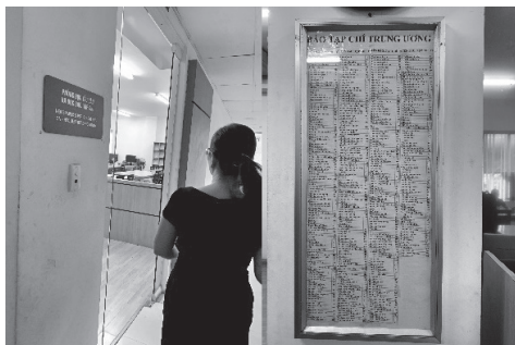
新聞雑誌室の入口 新聞雑誌タイトル一覧

新聞雑誌室の入口を入ったところには、排架されている新聞雑誌のタイトル一覧表が掲示されており、この表で目当ての新聞雑誌を