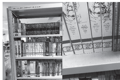
テープの色によって分類を区別

閲覧室のローテーションは、朝8時から午後2時までと、午後2時から午後8時までを1人ずつで担当し、排架整頓は、その交代時と閉館時に行うとのことである。（以下次号）