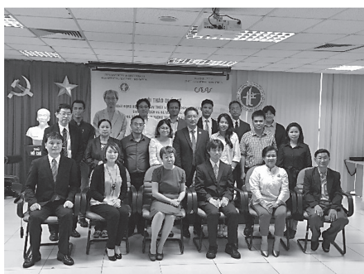
S&Wでの記念撮影写真。筆者は後段左から3人目

筆者は、京都大学東南アジア地域研究研究所 (CSEAS) からの依頼を受け、2019年9月17日・18日の2日間、ベトナム・ハノイ市で開催された「東南アジア地域研究情報資源の共有化をめざして」(京都大学東南アジア地域研究研究所 (CSEAS)・ベトナム社会科学通信院 (ISSI) 共催) というシンポジウム&ワークショップ 1 (以下「S&W」という。)に参加するため、同月15日から20日まで、ベトナム・ハノイ市に出張する機会を得た。