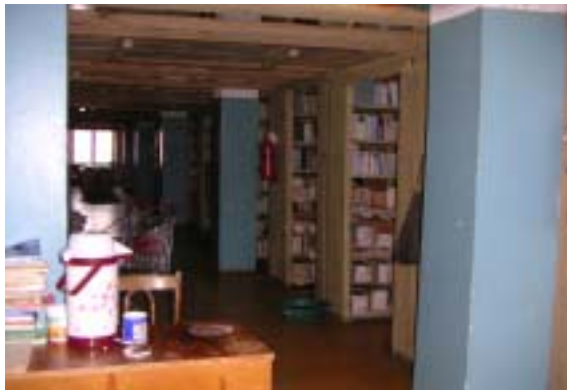
(書庫。床に置かれたたらいには、書庫内の湿度を上げるために水がはられている)

また館内には有料でインターネットが利用できる部屋もあるが、これは図書館ではなく外部の団体が運営しているインターネットカフェのようなものである。