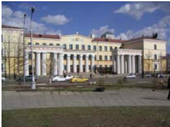
(モンゴル国立中央図書館)

УТНСは研究者を利用の対象にしているが、大学の授業期間中は大学生の利用が非常に多く、閲覧室が混雑している。ウランバートル市には УТНС のほかに、モンゴル国立大学図書館をはじめとする大学図書館、公共図書館としてナツァグドルジ記念ウランバートル市中央図書館などがある。