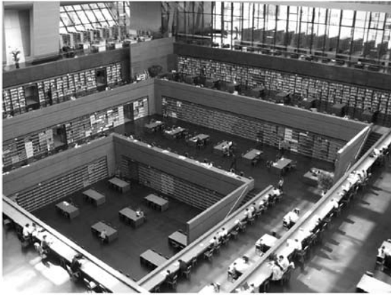
写真2 中央の閲覧室

データを読み取って、OPAC のデータに反映している。排架整頓は定期的に行われており、排架ミスがあれば、この機器で即座にチェックされる。