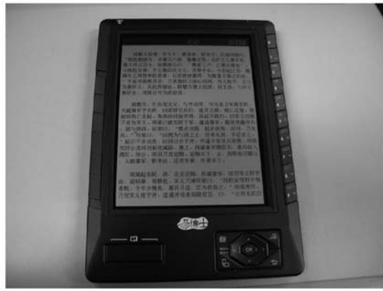
写真6 ポータブル閲覧器

今回紹介した新館のサービスのほか、中国国家図書館は近年、オンラインチャット方式のレファレンスサービスや、携帯電話を使った情報提供サービス 8 、視覚障害者向けの電子図書館サービス 9 など、利用者のニーズに即した新しいサービスを次々と打ち出している。また、電子図書館分野における躍進ぶりも目を見張るものがある。そこからは、ハード・ソフトの両面から総合的に設計された最先端の図書館サービスを提供していこうという強い姿勢が感じられ