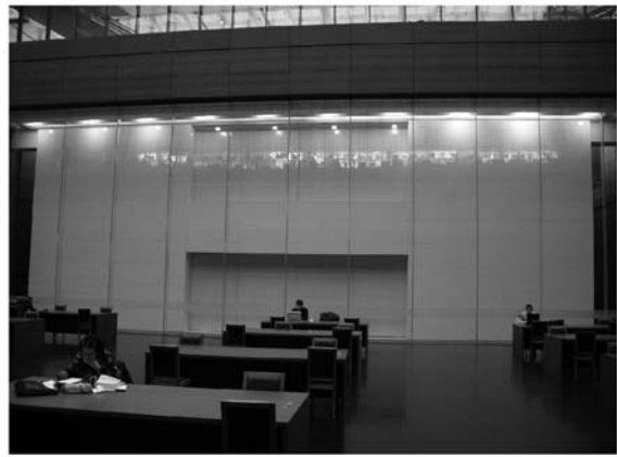
写真3 『文津閣四庫全書』を収蔵する保存書庫

地下1階は四庫全書エリアである。四庫全書に関連する影印叢書類や辞典類のほとんどが開架されている。さらに、空調管理が施され