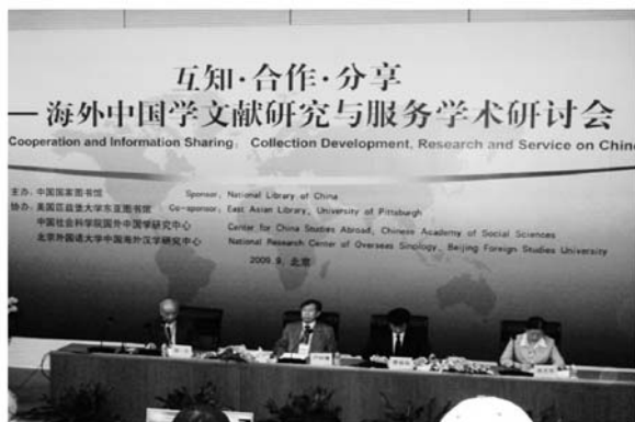
写真1 海外中国学シンポジウム全体会議

北京外国語大学海外漢学研究センターが共催しており、中国内外の研究者、図書館員等約100名が参加した。