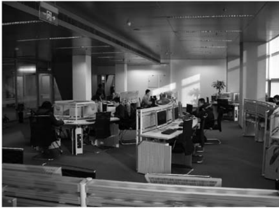
写真5 電子資料閲覧室

PW を入力すれば、1 時間は無料で利用できる。インターネットの閲覧も自由だ。1 時間を超えると1 時間につき3 元（1 元は約14 円）が課金されるので、事前に利用カードにデポジットしておく必要がある。また、ポータブル閲覧器の館内貸与も行なっており、これにPC から電子資料をダウンロードして、館内の随意の場所で利用することもできる（写真6）。