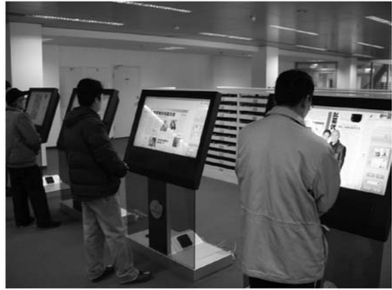
写真4 大型閲覧器で新聞を読む利用者