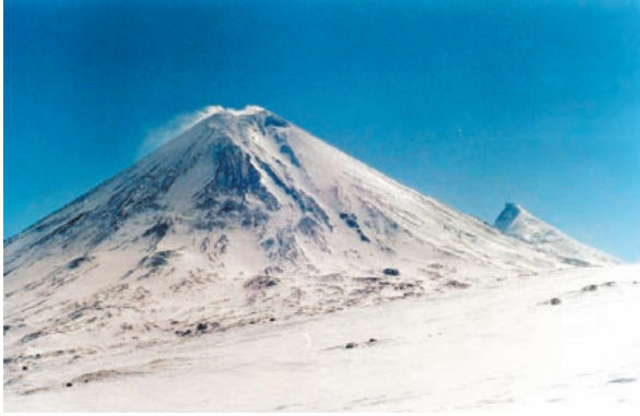
第2図 クリュチェフスカヤ山