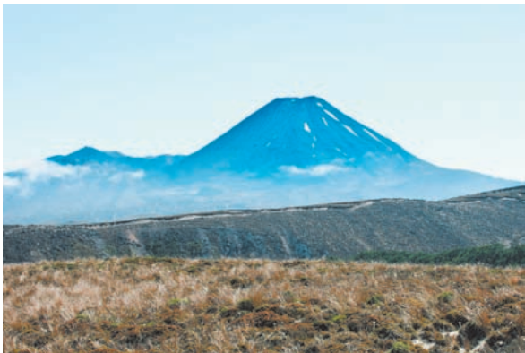
第3図 ナウルホエ山