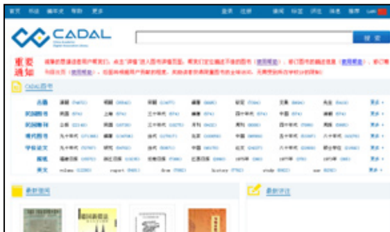
図 1 CADAL ポータルのトップページ

CADAL のデジタル化資料は、CADAL ポータル 8 (図 1) から閲覧することができる。以下では、2014 年 1 月現在公開中のインタフェースにより、利用登録から資料閲覧までの流れを概観する。