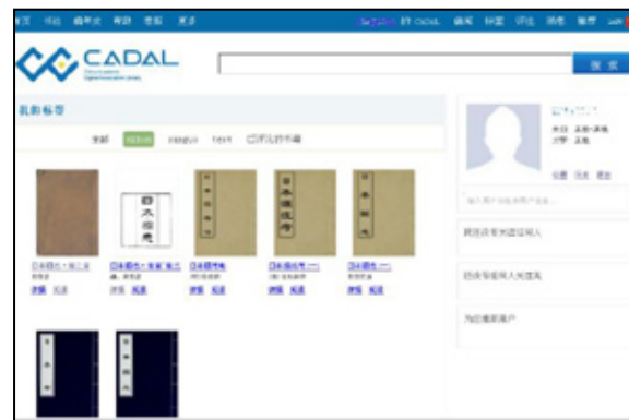
図5 タグを付けた資料の一覧画面

閲覧した資料には、タグを付けることができる。タグを付けた資料は、CADAL トップページやユーザ情報のページ上の「标签 (Tag) 」から一覧できる (図5)。資料の種類や関心によって、自由にタグを設定し、分類することができる。