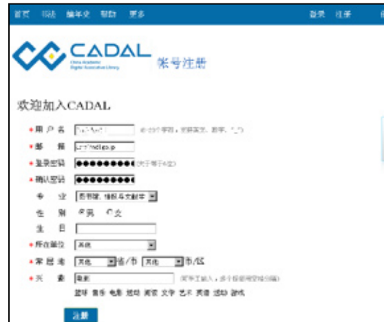
図 2 CADAL ポータルの登録画面

ユーザ名 (用户名 Username)、メールアドレス (邮箱 Email)、パスワード (登录密码 password)、確認密码 confirm password にも入力)、所属機関 (所在单位 From)、居住地 (常住地 Residence)、関心 (兴趣 Interest) が必須項目である。このほか専攻 (专业 Major)、性別 (性别 Gender)、生年月日 (生日 Birthday) が任意項目である。必須項目を入力の上、画面下部の「登録」をクリックすると登録完了である。