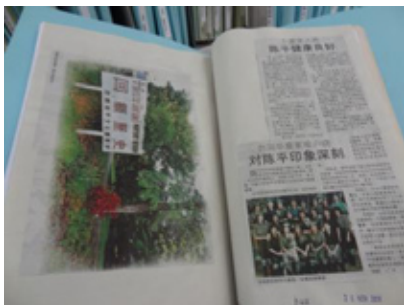
写真 2 分類記号別にスクラップされた新聞記事

新聞記事切り抜きコレクションは、1985 年の開館時から現在まで、中断することなく継続され、すでに 150 万件以上もの記事が蓄積されている。マレーシアの新聞記事アーカイブとしては、他に類を見ない貴重なコレクションである。同館では、マレーシアで刊行されている新聞を出来る限り網羅的に収集している。職員は、その全てに目を通し、ほぼ全ての記事について、書誌情報と 2,000 以上に細分化された分類記号 20 を付与して保存している（写真 2）。館内利用に限るが、記事タイトル、収録紙、日付などを検索できるシステムもある。