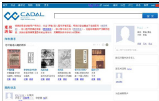
図3 ログイン後のユーザ情報画面

ログイン中は、画面上部に「(ユーザ名) 的 CADAL」という文字が表示され、これをクリックすると、ユーザ情報の画面に遷移することができる。