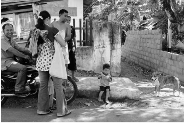
図3 路上を徘徊する犬。飼い主はいても係留はされない。

なっている。インドネシアでは、全国に家畜の検査所が7カ所ある。そのうちの2カ所、すなわち、北スマトラのメダンにあるもの、バンダルランブンにあるものはJICAの援助で建設された。さらに、現在、新たに8カ所目を西ジャワ市のスパンに作るプログラムが進行中である。また、これとは別に、グヌーシンルーにあるNVDAL（薬物検査所）もJICAの支援を得ている。私達の国にとっては、たいへん有り難く感謝している。