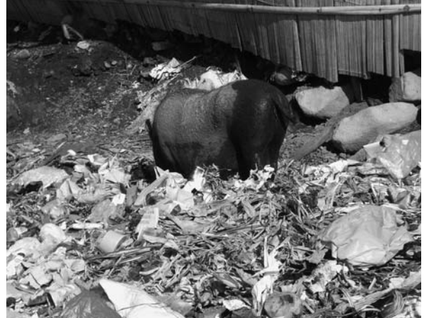
図4 フロレス島のゴミ捨て場をあさる豚。この国では豚も犬も放し飼いである。

フロレス島は、赤道直下の南緯8度で東西にサツマイモを細く長くしたような島である。人口約150万人。その70%はカトリックで、後は、プロテスタント、ヒンズー、イスラムを合わせて30%である。長さとは幅は350キロと60キロで、その西端にはコモドドラゴンで有名