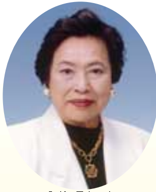
千葉県知事 堂本 暁子

染を防止し、自然環境の保全や回復に取り組んでいます。また、県水道局でも水質管理体制を強化し、高度浄水処理の導入を進めるなど、皆様に良質な水を安定してお届けするため積極的に事業を進めています。 この水道週間にきっかけに、水道事業についてより一層の御理解と御協力をお願いいたします。