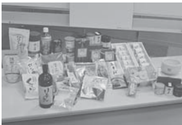
西尾の抹茶入り商品。

面白いところでは、抹茶焼酎「抹茶泉（まっちゃせん）」があります。市内の相生ユニビオとの共同商品で、『西尾の抹茶』と国産米を使って丁寧に作った本格焼酎です。