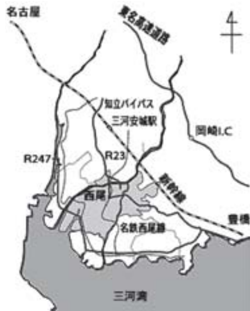
愛知県の西三河地方に位置する西尾市。

抹茶に使われるのは、日光を避けて育て、蒸したのちに葉柄を取り除き乾燥させた「てん茶」と呼ばれる茶葉。西尾市を中心に隣接する安城市と吉良町の2市1町で年間約400トン（2007年実績）のてん茶が生産されており、全国生産量の約20%のシェアを誇る。これを原料に同地域で製造された抹茶が、『西尾の抹茶』となる。