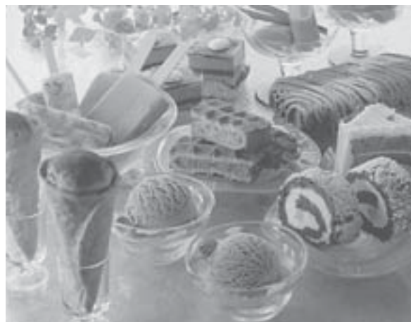
抹茶の食品加工用原料としての道を大きく開いた抹茶アイス商品。あの「ハーゲンダッツ」の抹茶アイスにも西尾の抹茶が使われている。

当初、このチャレンジには想像以上の困難が待っていた。まず、食品メーカーの反応が非常に