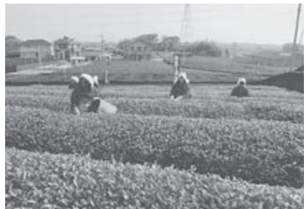
立春から数えて88日目となる八十八夜（今年は5月2日）には、毎年かすり姿の女性たちによる茶摘みが行われる。

さらに、品質管理への意識も高い。最近ではバイオテクノロジーを取り入れた害虫防除に加え、クリーンルームでの製品製造も実現。抹茶では不可能と言われていた有機栽培の開発に取り組み、