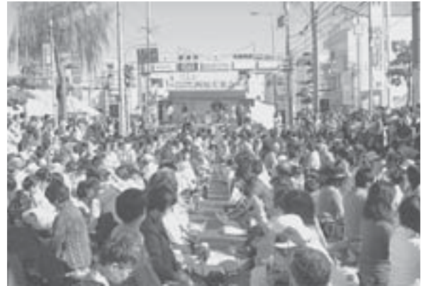
ギネス記録を見事更新した「まちなか1万人・西尾大茶会」の様子(2006年10月8日)。記録はその後、インドのティーパーティに抜かれた。

抹茶の産地としてのPRと市中心部の活性化を目指して、話題性の高いギネス更新にチャレンジしたもののだが、プロジェクトを進める段階で、愛知県や西尾市といった「官」、西尾商