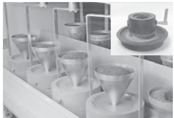
19世紀の石臼（右上）と、現在の茶臼製法の様子。