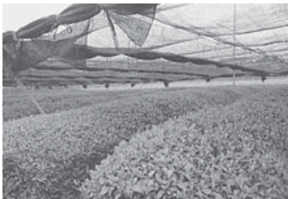
稲荷山での棚田生産の様子。

これは、西尾市とその周辺地域の恵まれた自然条件だけによるものではなく、その栽培方法によるところも大きい。一般に、てん茶の茶樹は、成長の過程で一定期間、日光をあびないように覆いが被せられる。こうすることで、大きな葉をつくり、濃い緑色に変化するのである。また、茶葉に含まれる渋み成分（タンニン）が抑制され、甘み成分（テアニン）を増やす効果も狙うのである。