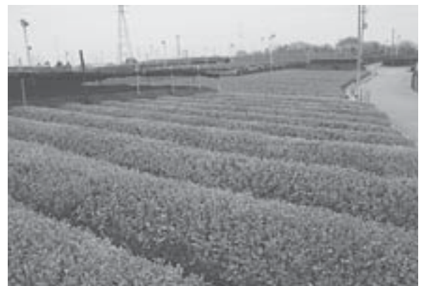
稲荷山に広がる茶園風景。