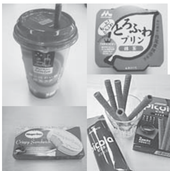
現在、『西尾の抹茶』使用のナショナルブランド商品も次々発売されている。