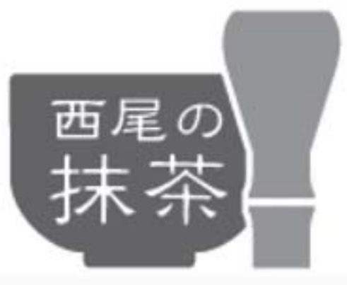
「西尾の抹茶」ブランドマーク。