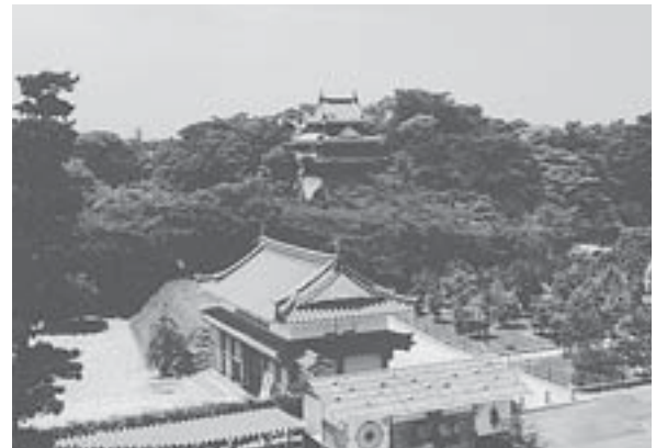
西尾城の一部が復元され、城下町の面影を今にとどめる西尾市歴史公園。