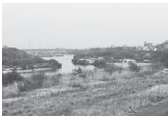
西尾市とその周辺地域に豊かな恵みをもたらす矢作川。

今年（2009年）2月、『西尾の抹茶』は、特許庁が認証する地域団体商標、いわゆる「地域ブランド」を取得。「茶」の地域ブランドは、宇治茶、静岡茶、伊勢茶、美濃白川茶など全国に12例あるが、「抹茶」に限定した地域ブランドは全国初である。その取り組みへの経緯は後で述べるが、特筆すべきは、全国の茶どころの中でもめずらしい、