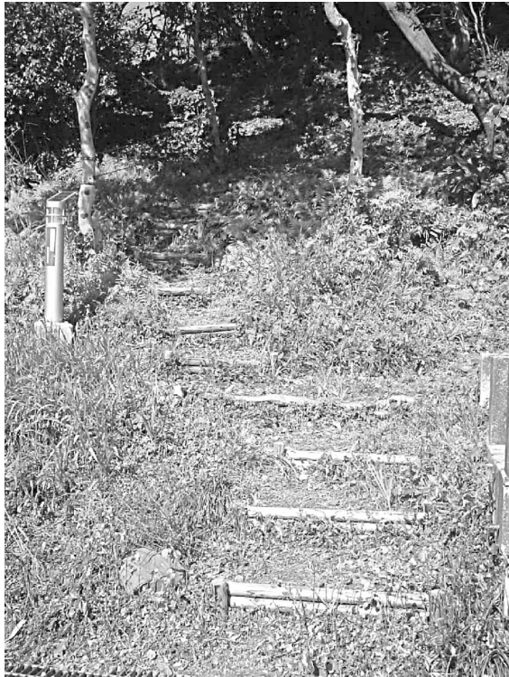
図5 住民自身が整備した津波避難路