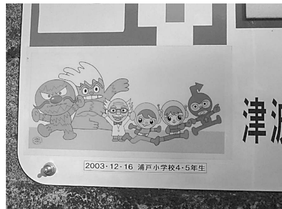
図4 津波避難標識の防災キャラクターのシール

避難場所がないのが課題である。既存の建物を改修し、屋上を避難場所にする案など、避難場所候補地は8ヶ所挙がっているが、財源不足の中では改修は支援がないとなかなか難しく、高知県単独では不可能なので、検証を行った上で国に要望を出していくとのことである。