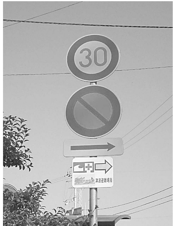
図3 道路標識のポールに設置された津波避難標識

* 矢印には夜間でも発行する蓄光石、矢印の縁には反射板を使用している。1枚約25,000円と安価であるため、多くの箇所に設置可能であり、設置の際には、コストの観点からなるべく既存のポール等を用いるようにしている。