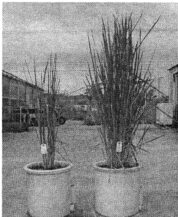
IL- srt1 オオチカラ 第1図 地上部の写真