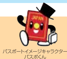
パスポートイメージキャラクター パスポくん