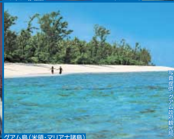
グアム島(米領・マリアナ諸島)