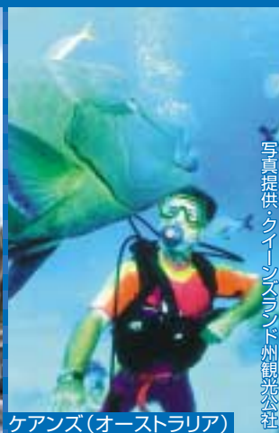
ケアンズ(オーストラリア)