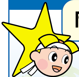
岡山県マスコット ももっち

韓国の首都・ソウルや中国最大の経済都市・上海へは 定期便が毎日運航。また、常夏のリゾート・グアム島へも 週2回の定期便があります。さらに、これらの都市から乗 り継いで、ヨーロッパ、アメリカ、オセアニア、東南アジア など世界各国へ行くことができます。