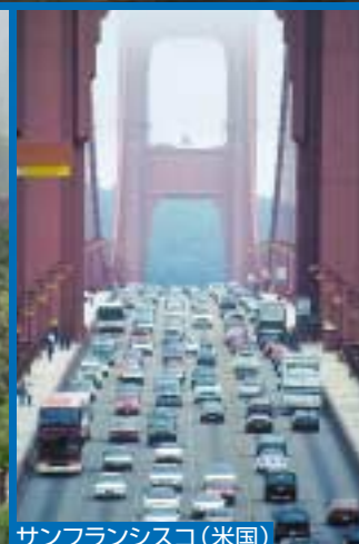
サンフランシスコ(米国)