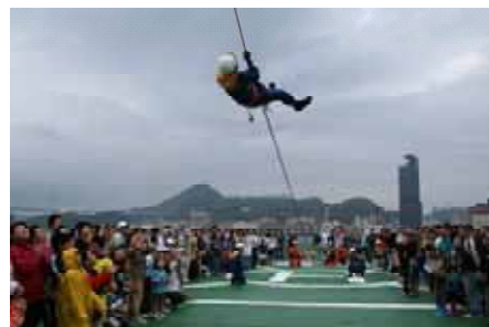
巡視船「はかた」甲板上での「機動救難士」による展示訓練