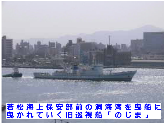
若松海上保安部前の洞海湾を曳船に曳かれていく旧巡視船「のじま」

TVドラマ海猿で、主人公仙崎大輔が乗船する「巡視船ながれ」として撮影された旧 1,000 トン型巡視船「のじま」が、4 月下旬スクラップとして解体されるため、若松海上保安部前の洞海湾を北九州市若松区内の解体業者まで曳船に曳かれていきました。