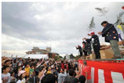
【模擬上棟式は賑わいました】

登米市の様々なモノづくり産業や関連企業を紹介し、市民との「ふれあい」の場を提供する登米市産業フェスティバルが10月23日に開催されました。