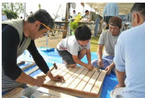
【親子で踏み台をつくりました】