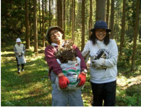
【まいたけを手にして笑顔！】