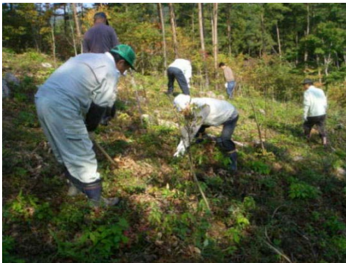
【山林の下刈り作業体験】

東和町の米川活性化サポート会議では、秋期事業として10月8日に「きのこ狩りと木工教室」、翌日9日には「きのこ狩りと下刈り体験」を実施し、多くの参加者で賑わいました。