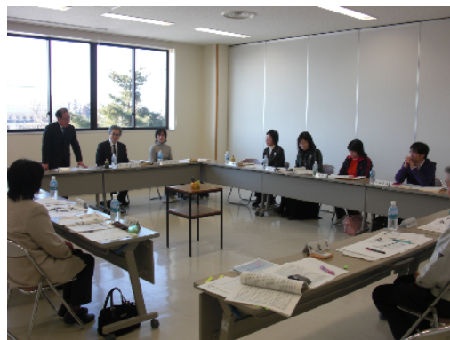
第2次阿賀野市男女共同参画プラン（案）は市民の方からなる阿賀野市男女共同参画プラン推進協議会で検討され策定されました。

阿賀野市は、4月から第2次の阿賀野市男女共同参画プランに基づき事業等を進めていきますが、推進のためには、企業・事業所の方の協力が必要であることから、理解・協力を得ながら“男女がともに参画し、夢と幸せをはぐくむまちづくり”を目指して推進していきたいと思えます。