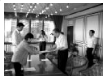
9月20日、四日市市民協働研究会の提言書が四日市市長に手渡されました。

目指した「四日市市民協働研究会」が、本年7月に立ち上がりました。7月から9月にかけて6回の研究会を行い、その成果を「四日市市の市民協働を促進させるためのしくみづくりの根拠条例制定に向けた提言書」にまとめ、9月20日市長に提出しました。