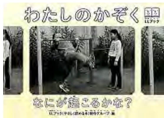
『わたしのかぞく』 じゅそんぼう 樹村房

むずか ひょうげん にほんご にがて ひと りょう 難しい表現や日本語の苦手な人に利用しやすいよう、やさしい ことば しゃしん え つか よ 言葉づかいで、写真や絵などを使って、わかりやすく読めるように くふう ほん 工夫した本です。