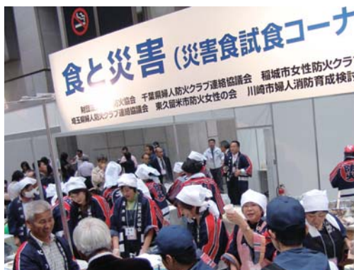
災害食試食コーナー