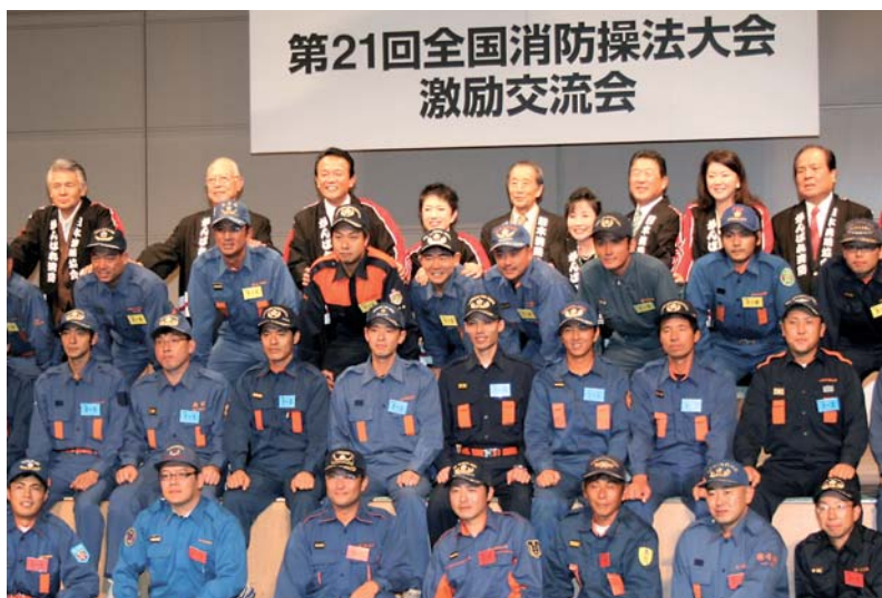
全国消防操法大会に出場する選手たち