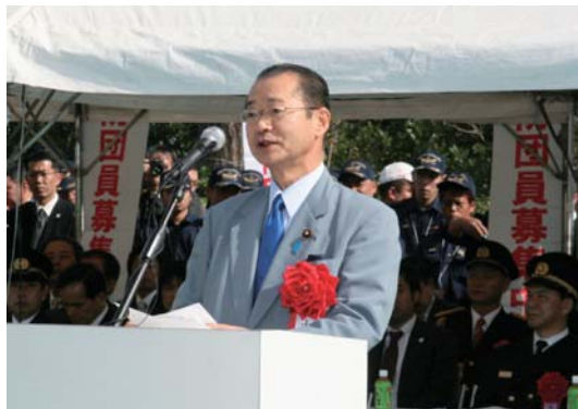
祝辞を述べる河村建夫内閣官房長官