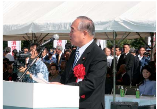
祝辞を述べる中村博彦総務大臣政務官