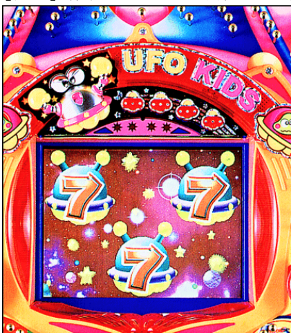
【図 2】 機種タイトルを明記したネームプレートの例