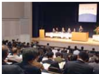
小出郷文化会館での全体会議

これからの成長分野である健康・福祉・医療関連産業を後押しする目的で、新潟県・魚沼市などで組織する実行委員会の主催による健康ビジネスサミット「うおめま会議」が11月13日と14日の両日、小出郷文化会館などで開催されました。全国から各分野の企業、医療、行政関係者が集まり、全体会議、個別会議、フリンジ(関連)イベントなどを行い、それぞれの課題について議論されました。この会議は、“自然が豊かで健康に適した環境”“医療と観光の連携などで先進事例を有する”うおめま地域(魚沼市など3市2町)において、毎年開催される予定です。