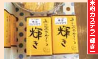
パッケージはふんわりと焼き上がったカステラをイメージしています