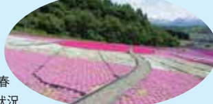
平成20年春 芝桜開花状況

また、この公園は「魚沼の里山公園の創出」をテーマに里山ゾーン、花のゾーン、自然観察遊歩道、ふれあい広場があり、自然、花の景観など四季折々の表情を楽しむことができます。