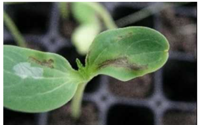
汚染種子由来のBFBの病徴(スイカ)

業務の大部分を占める依頼検査では近年急激に検査点数が増加し、病害に対する種苗業界の関心の高さを肌で感じています。特に、ウリ科野菜の果実汚斑細菌病(Bacterial Fruit Blotch: BFB)、アブラナ属野菜の黒腐病及び根朽病、ニンジン斑点細菌病は依頼数が多く、この中でもBFBは予約制を設けざるを得ない程の依頼状況にあります。このBFBは主に種子で伝染するウリ科作物の重要な病害の一つであり、我が国では10年に初めて発生を確認した関心の高い種子伝染性病害です。種苗管理センターでは独自に開発したSweat-bag seedling法を基に構築した検査法により24年から検査を開始しました。開始当時はスイカやメロンの依頼が主でしたが、昨年からはカボチャが主流となっています。現在も本検査法の改善を行い依頼の増加に対応するとともに対象作物の拡大を図っております。また、病害検査対象の拡大を図るため、農林水産省植物防疫所、その他農林水産省所管の研究所や種苗会社の協力を得ながら調査研究を実施しています。