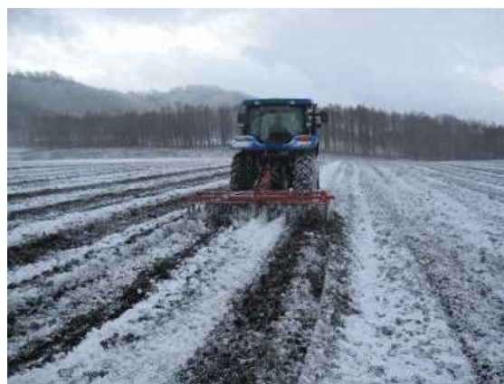
初冬のデスクハロー掛けによる野良いも処理

1年の農作業は、長い冬の季節が終わりを告げ陽光の増してくる3月下旬に融雪剤散布が開始され、その後、種いも切断、植付が行われます。そして、管理作業、収穫、選別と作業が進み、11月初冬のデスクハロー掛けによる野良いも処理で、外の農作業は終わりを告げます。冬の間は主にウイルスなど病害の検定作業に追われ、1年が経過していきます。