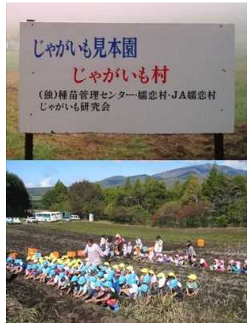
上：見本園の看板（開園当時）

孀恋農場では、今後もじゃがいも見本園を継続していきたいと考えていますので、これからも皆様のご協力をお願いいたします。