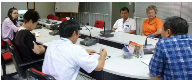
聞き取り調査風景

調査の期間は平成27年11月9日～13日、場所はタイ農業協同組合省農業局植物品種保護オフィス、国の研究機関、大学、民間種苗関連会社等12か所で、それぞれを訪問し聞き取りを行いました。以下、調査の概要を報告します。