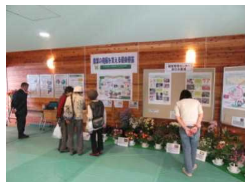
センター業務の紹介、展示の様子