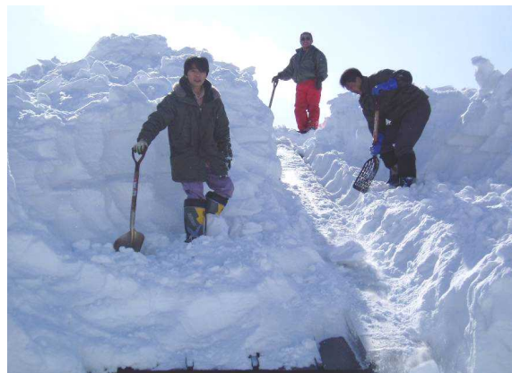
屋根の雪下ろし作業風景

また、羊蹄山麓地帯は北海道でも有数の豪雪地帯で、当分場でも296cmという記録があります。そのため冬季には、場内施設周辺はもとより、宿舎周辺の除雪が連日行われることとなります。また、職員総出で行う施設の屋根の雪下ろし作業も後志ならではの大変な仕事です。