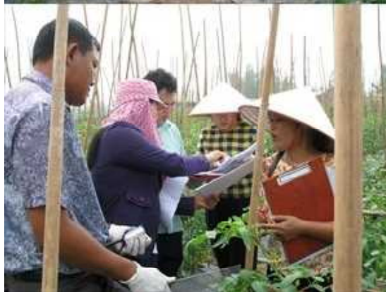
調査ほ場・実習の様子

調査後、品種保護室で使用されている報告書作成機能を有した審査・栽培試験データベースを使って報告書を作成し、各グループの代表者により調査結果の発表が行われました。評価に違いがあった形質については調査方法を確認するとともに、再度ほ場に出かけ現物を見ながら再評価を行い、各自納得のいく形で実習を終えることができました。