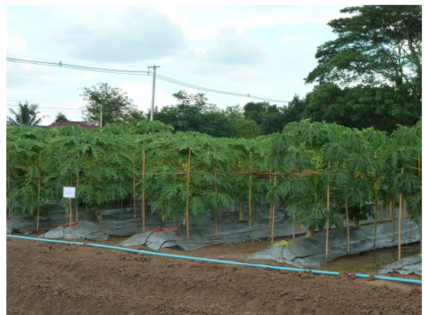
品種特性調査ほ場（パイナップル）

タイでは、登録出願品種の審査や輸出入時の種子検査を行う施設を4か所建設中（うち2か所完成）であり、次年度から栽培試験を実施する予定です。今後栽培試験に関する体制の強化及び実施に際し、日本の技術や制度に関する情報交換・協力が重要と思われます。タイと信頼関係を築きつつ、ASEAN諸国での品種登録制度や育成者権の保護・強化のための連携及びルール作りの実現に向けて一層取り組んでいきたいと思っております。