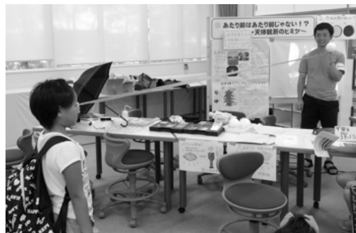
図2 地球と月との位置関係を実感させる 月と地球の距離把握教材(本実践による)