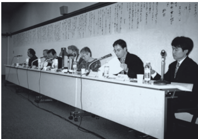
連詩制作の後に東京のプリティッシュ・カウンシルで開催された公開シンポジウム (1998年10月17日)