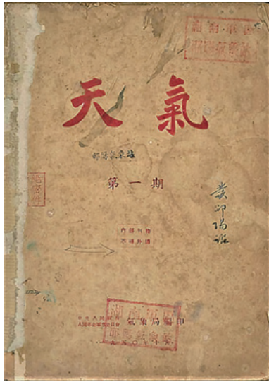
図1 『天気』第1期の表紙（周氏所蔵）

国家機密の幅広さを示す端的な例として、中華人民共和国初期に人民解放軍の中央軍事委員会気象局が発行していた『天気』という内部雑誌がある。天気予報を各地に知らせるためのものだが、表紙の左側に極秘を意味する「絶密件」印が押されている。これは、天気すら国家機密に含まれたことを示している。当時は『人民日報』でも天気を掲載していなかった。