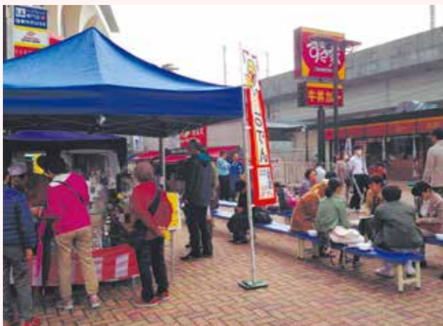
北区おでん月間ファイナルイベント(2014年11月)