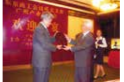
広州・上海産業視察会 (2006年)