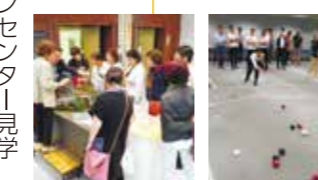
女性会文士村視察会(2018年)