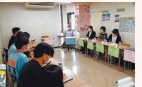
JET日本語学校との意見交換会(2022年6月)