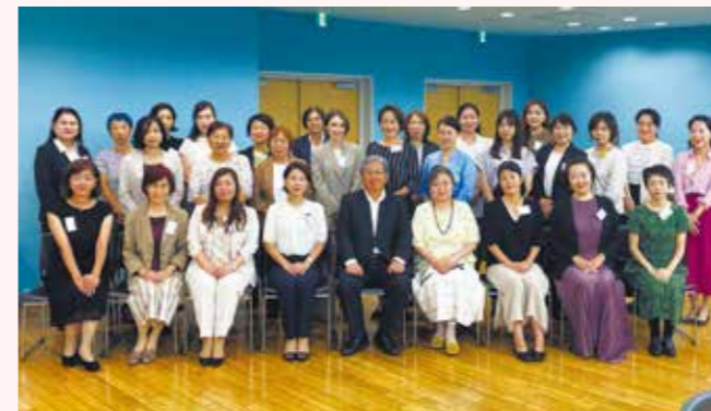
女性経営者交流会(2023年9月)