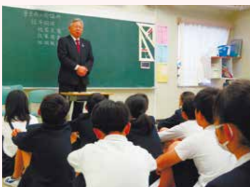
起業家育成プロジェクト(2023年11月)