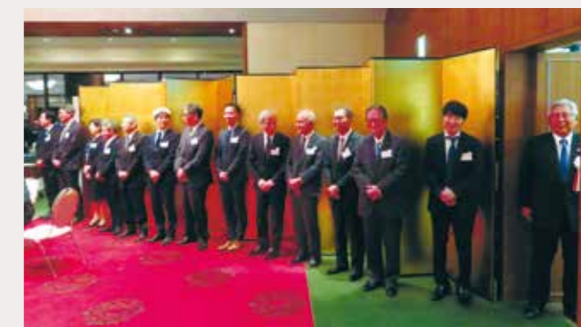
越野会長と支部副会長による答札