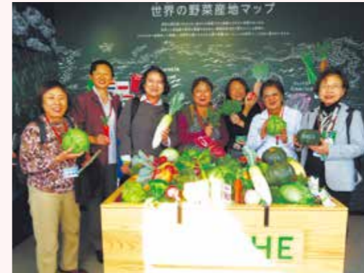
研修旅行 カゴメ野菜生活ファーム富士見の視察会(2019年10月)