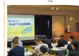
公民連携勉強会(2023年)