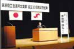
30周年記念講演会 (2004年)