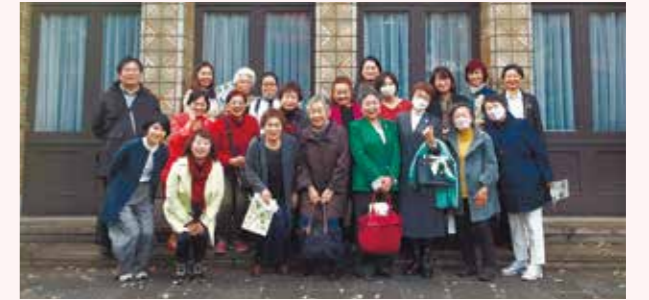
江東支部女性部会との合同事業(2022年11月)