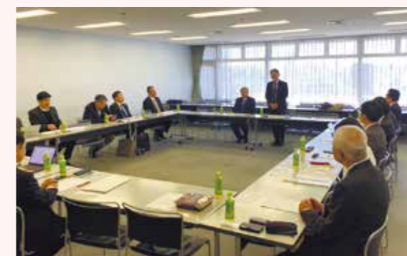
第1回北区地産地活エネルギー勉強会(2023年12月)