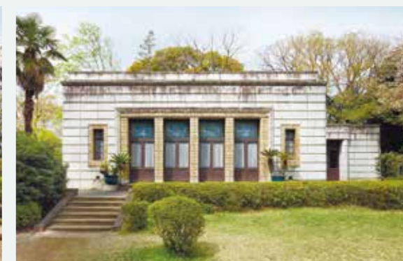
青淵文庫 正面(飛鳥山公園内)