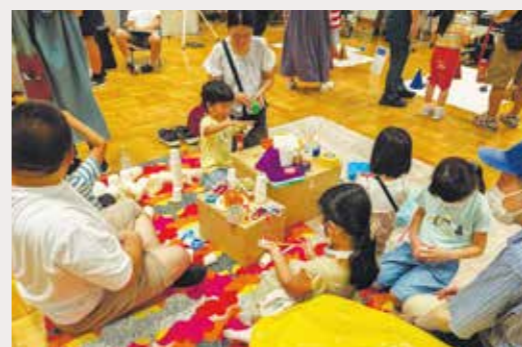
JimoKidsによる子ども向け渋沢ワークショップ