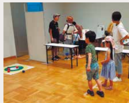
青年部によるポッチャ体験会