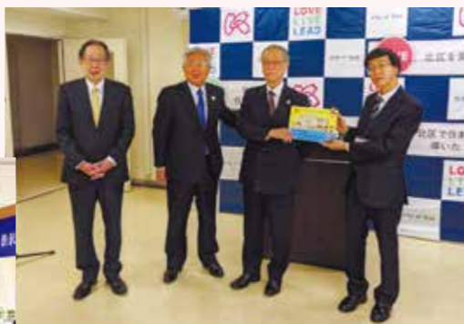
渋沢栄一が教えるお金の絵本「おかねってなあに？」贈呈式(2021年11月)