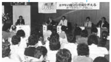
青少年の健全な育成を考えるシンポジウム (1982年)