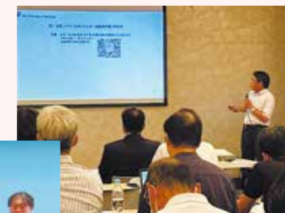
ペロブスカイト太陽電池講演会 (2023年9月)