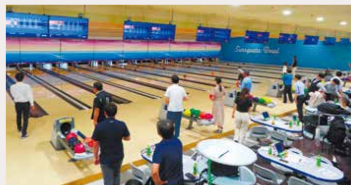
32チーム96名が熱戦を繰り広げた