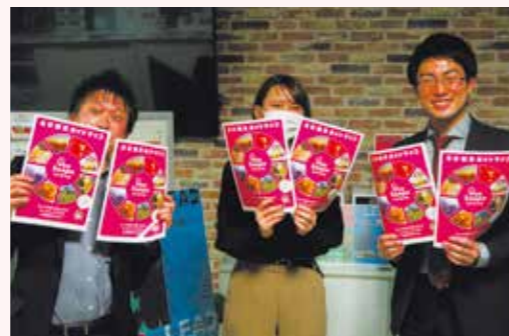
北区観光ガイドマップ「クアサンポ」発行(2021年2月)