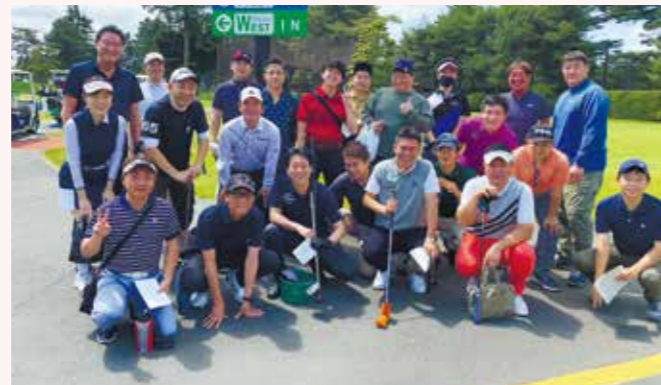
ゴルフコンペ(2023年5月)