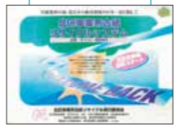
リサイクルシステムポスター(1997年)