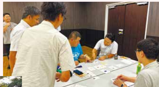
SDGsカードゲーム(2023年7月)