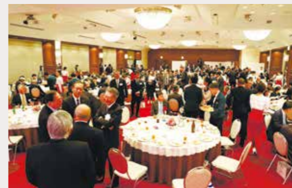
祝賀パーティーの様子