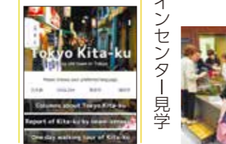
Tokyo North Site (2017年)