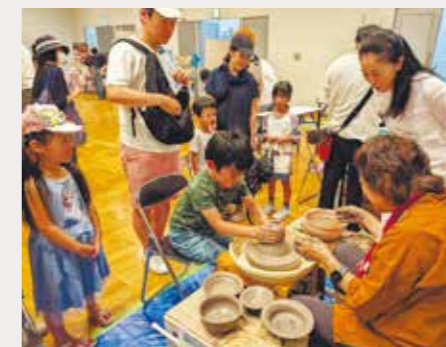
青年部による北区伝統工芸の体験会