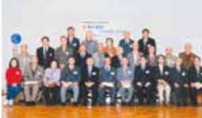
北区発見！フォトコンテスト (2003年)