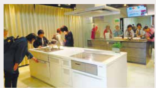
LIXILサンウエーブ製作所深谷工場

開催日 2024年9月25日（水） 視察先 LIXILサンウエーブ製作所深谷工場、 キューピー深谷テラス ヤサイな仲間たちファーム、 旧沢沢邸「中の家」、 旧煉瓦製造施設「ホフマン輪窯6号窯」 参加 28名（事務局含む）