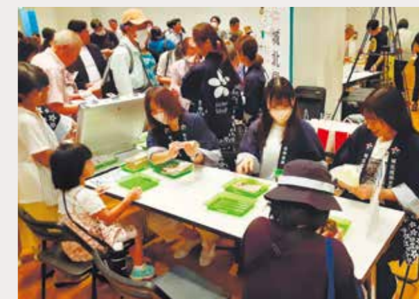
約800名の親子が来場