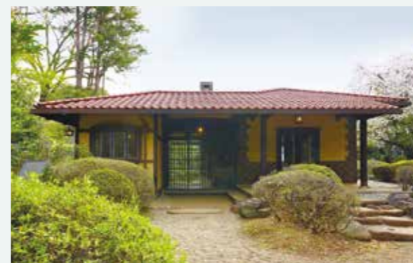
晩香廬 正面(飛鳥山公園内)