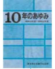
10周年記念誌表紙 (1984年)