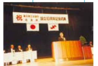
北支部設立10周年記念式典 (1984年)