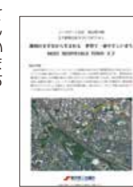
王子駅周辺まちづくりビジョン(2014年)