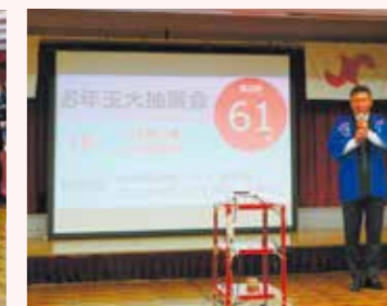
賀詞交歓会 お年玉抽選会