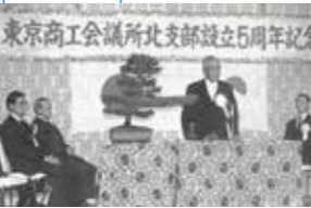
北支部設立5周年記念式典 (1979年)