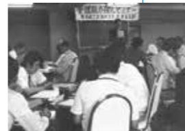
管理能力強化セミナー (1980年)