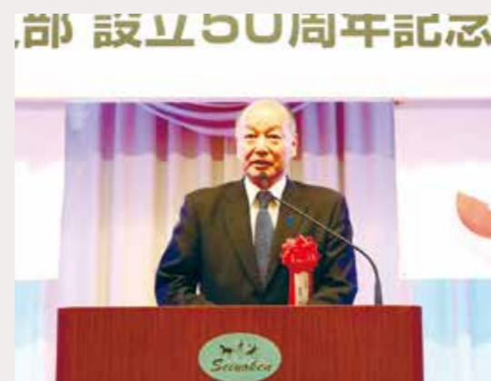
高木けい衆議院議員による来賓あいさつ