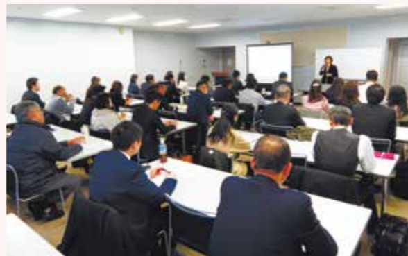
売れるセールストックの身に付け方(2019年12月)