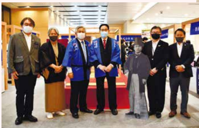
物産展「渋沢栄一のおもてなし」を東商本部で開催(2021年10月)