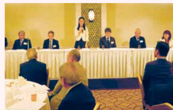
北区長と支部役員との懇談会・年末懇親会(2023年11月)