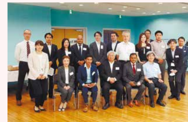
外国人経営者交流会(2023年5月)