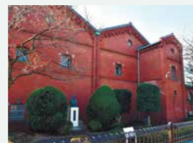
旧醸造試験所第一工場

醸造技術の研究・発展を目指し、1904(明治37)年に清酒醸造試験工場として設立。渋沢が立ち上げた日本煉瓦製造会社のレンガで作られた。