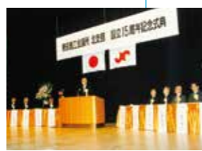
北支部設立15周年記念式典(1989年)