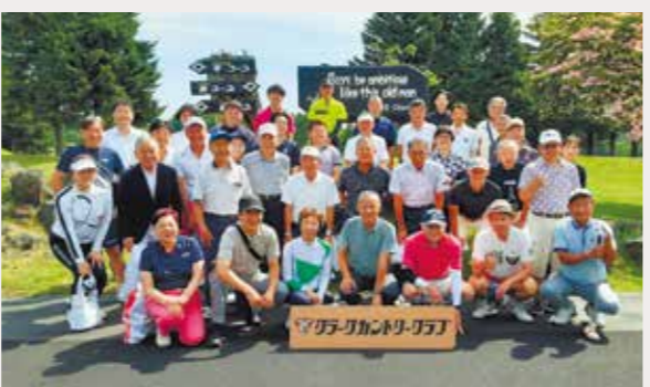
7月5日 クラークカントリークラブ（39名）