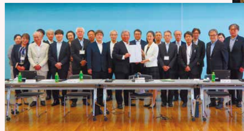
北区長と支部役員との懇談会(2023年10月)