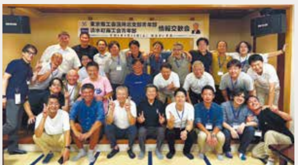
清水町商工会青年部との情報交歓会