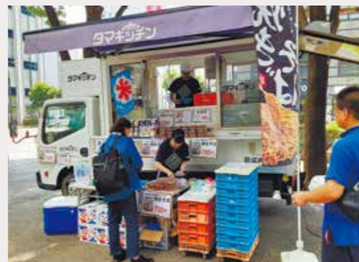
北とびあ正面入口前でのキッチンカー販売は初の試み