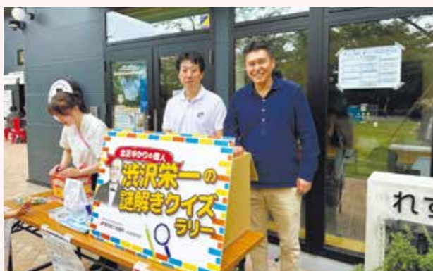
青年部による「渋沢栄一の謎解きクイズラリー」(2023年5月)