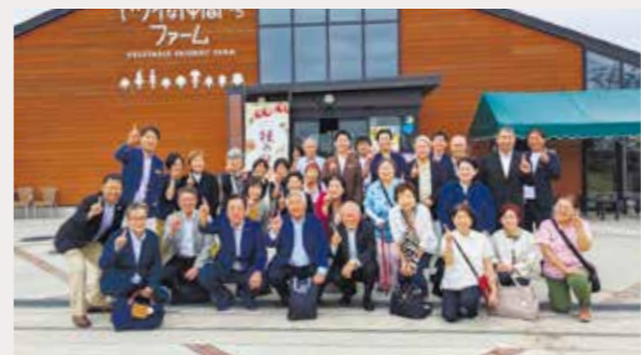
キューピー深谷テラス ヤサイな仲間たちファーム