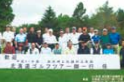
北海道ゴルフツアー (2009年)