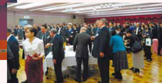
賀詞交歓会 懇親の様子