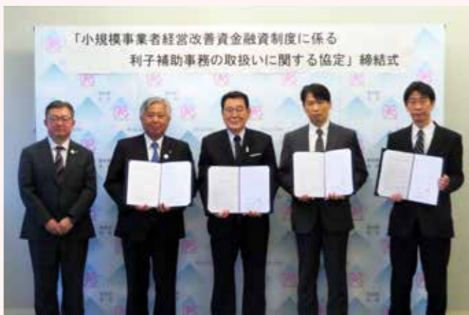
マル経融資制度に係る利子補助協定締結式(2022年3月)