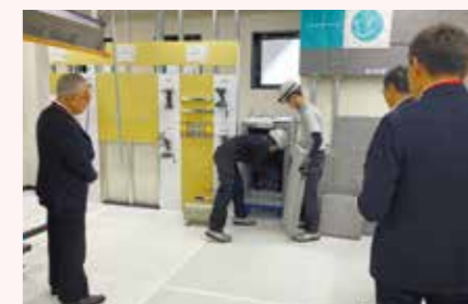
丸高工業サイレントシステムセンターショールーム視察会(2023年10月)