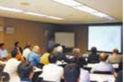
アドバネクス福島工場視察会 (2008年)