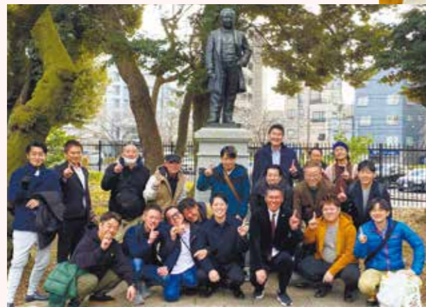
北海道十勝清水町商工会青年部との交流会(2024年1月)