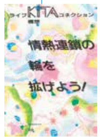
KITAコネクション表紙(1988年)