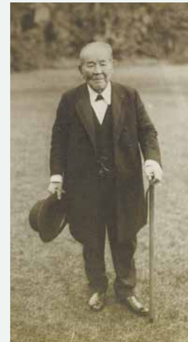
数え年88歳を迎えた渋沢栄一翁 飛鳥山邸内(1927年11月)