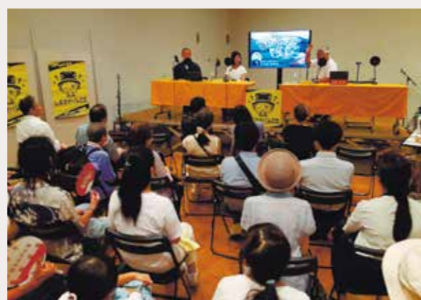
「しぶさわくんFM」公開収録の様子