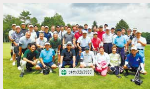
7月4日 ツキサップゴルフクラブ（41名）

開催日 2024年7月4日（木）・5日（金） 1泊2日 場所 ツキサップゴルフクラブ・クラークカントリークラブ