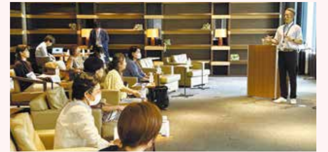
セキュリティ監視センター(ラック)視察会(2023年6月)