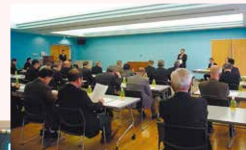
区内産業団体懇談会 都技監を招いた勉強会 (2016年3月)