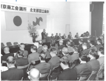
北支部設立総会 (1974年)