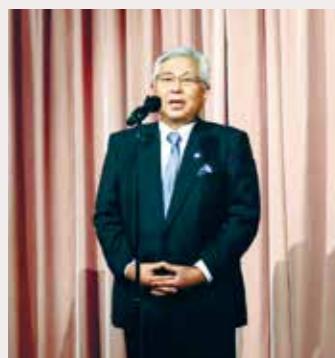
越野会長の開会あいさつ