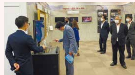
NTT東日本 e-City Labo 視察会(2022年10月)