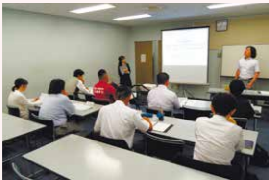
きた若手経営者セミナー(2018年5月)