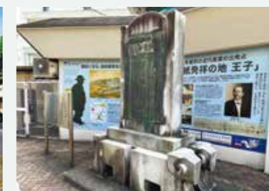
洋紙発祥の地碑(JR王子駅前)

大正時代に道路拡張工事で撤去されそうになったが、渋沢らの活躍によって撤去を免れ、後に国史跡に指定される。