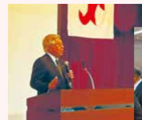
賀詞交歓会 越野会長挨拶 (2024年1月)