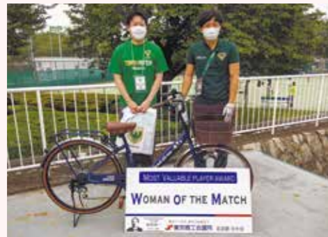
Woman of the Match(2021年9月)