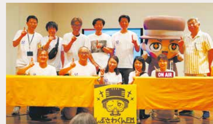
越野会長とワーキンググループメンバーによるエンディングセレモニー