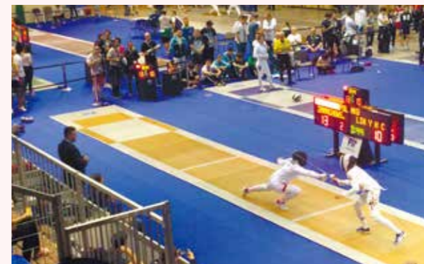
オーストリア・ハンガリー交流・視察会(2019年7月)