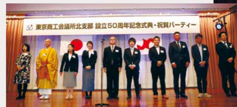
登壇する設立50周年記念事業ワーキンググループのメンバー