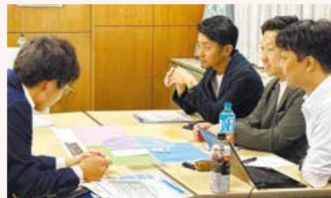
健康経営勉強会(2023年7月)