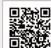
記念式典の様子 ▶ 動画