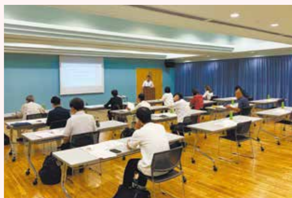
ワンストップ創業セミナー(2023年9月)