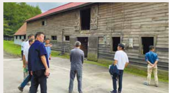
渋谷ファーム「十勝開墾合資会社の牛舎」