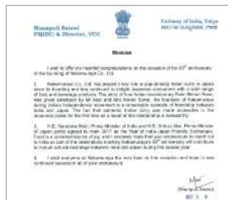
<写真: 左 日印協会 平林理事長 (右)、弊社代表取締役社長 鈴木達也 (左)、右 インド大使館からのお手紙>