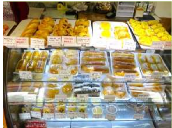
<写真：左 お店の外観、右 品揃え豊富な店内>