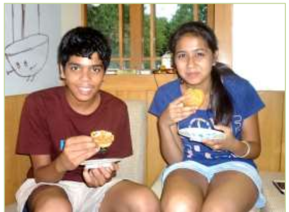
<写真：Irohaのシュークリームを頬張るインドの子どもたち>