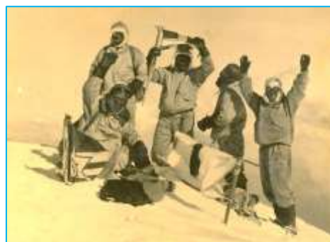
<写真：ナンダ・コート山頂に立った立教大学山岳部・遠征隊=1936 年 10 月 5 日撮影>

“登頂 80 周年記念登山隊”として頂上に埋められた三つの旗を持ち帰ることは、先送りとなってしまったが、“登れた感”と“やり切った感”が心のなかで膨らむ。何故か悔しさはわいてこなかった。初登ルートとは比ぶべくもない困難なアプローチに登頂へのルート。