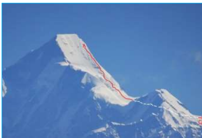
<写真：カウサニより撮影 700m に及ぶ滑り台、頂上雪壁最大傾斜 60 度：ナンダ・コート南壁と最高到達点 6750m（赤×印）>