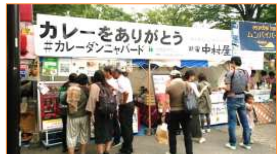
<写真: ナマステインディア店舗の様子>

インド大使館からは「カレーをありがとうキャンペーン」に対して、お祝いのお手紙を頂戴いたしました。