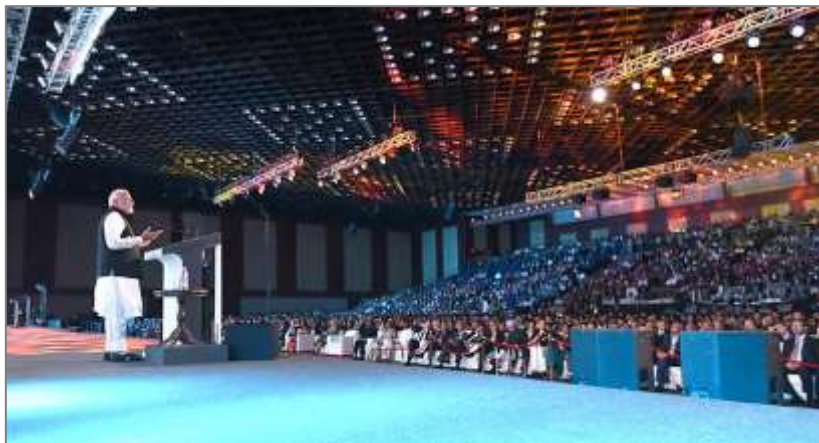
<写真：GES で演説をするモディ首相、PMINDIA より>