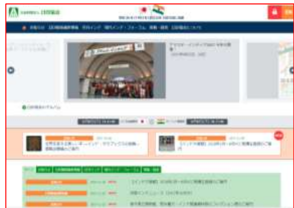
<協会のリニューアルされたホームページ画面>

ホームページのリニューアルに当たり、ご不便をおかけいたしますが、引続きのインド情報収集にご活用いただくよう、宜しくお願い致します。