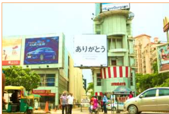
<写真：キャンペーンで、グルガオン（現：グルグラム）のMGFメトロポリタンモールへ設置した大型看板>

インドでは6月1日～30日の間、グルガオンのMGFメトロポリタンモールへ感謝の意を表した大型看板を設置しました。現地では「こんなに感謝してくれてありがとう」「日本人の律儀さに敬意を払います」といったコメントをいただきました。