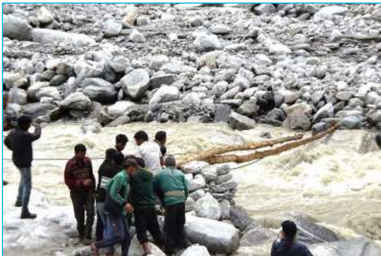
<写真：ビンダリ川とカフィニ川の合流するダワリ集落での橋造り ：流された橋を架ける>

だが、難点がふたつ、インドでは国の事情で登山に必要な五万の地形図が入手できないのである。測量局による5万図は刊行されているが、インド登山財団にすら一枚もなく、一般には全く入手不可能である。本屋などで入手できるのは50万図以上のもので登山には全く役立たない。ということはインド・ヒマラヤでの登山は、地図作りをしながらの大冒険？となるわけである。また、衛星電話は全く許可されない。こういった問題はそれぞれの国の事情だからしかたのないことだが、逆手にとってこのスタイルを楽しむような登山をすればそれはそれで面白い。外部連絡が旧態依然のメールランナーだけとなれば隔離された別天地、気分よく活動ができるというものだ。