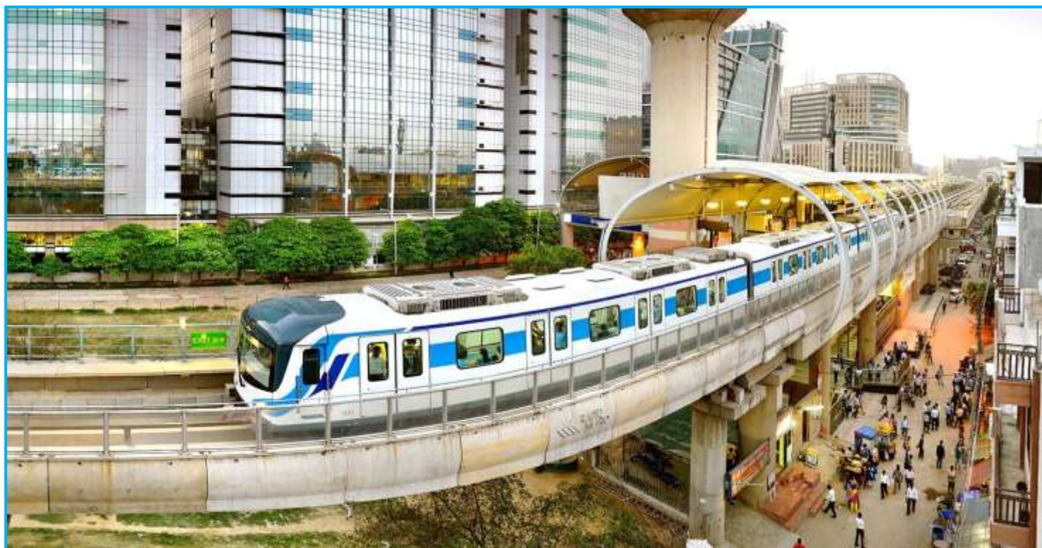
今年開通した、デリー南郊 グルガオン (現: グルグラム) のラピッド・メトロ線 オフィスと住宅街を結ぶ環状線