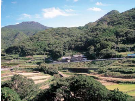
安満岳（左後方）を背にした構成資産（「平戸島の聖地と集落」の一部）の春日集落（平戸市）

ザビエルが平戸を去った後も、後を引き継いだトレスやガーゴ、ヴィレラなどの宣教師たちは、平戸、生月、度島 たくしま をめぐり、布教を続けました。1558年には、信者は1,500人にまで増えました。