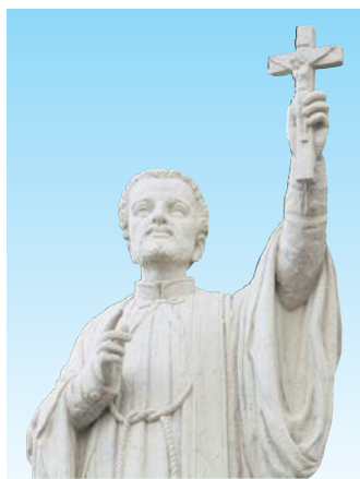
ザビエルの3度の来訪を記念して建てられた「聖フランシスコ・ザビエル記念聖堂」(平戸市)に立つザビエル像

今号は、16世紀にフランシスコ・ザビエルが訪れ、17世紀初頭の世界地図にはその名前が記されていた平戸の状況と、その後、貿易港が長崎に移るまでをご紹介します。